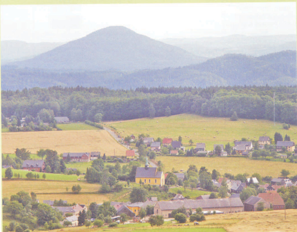
Obr. 1: Pohled na Hinterhermsdorf v německo-českém příhraničí.