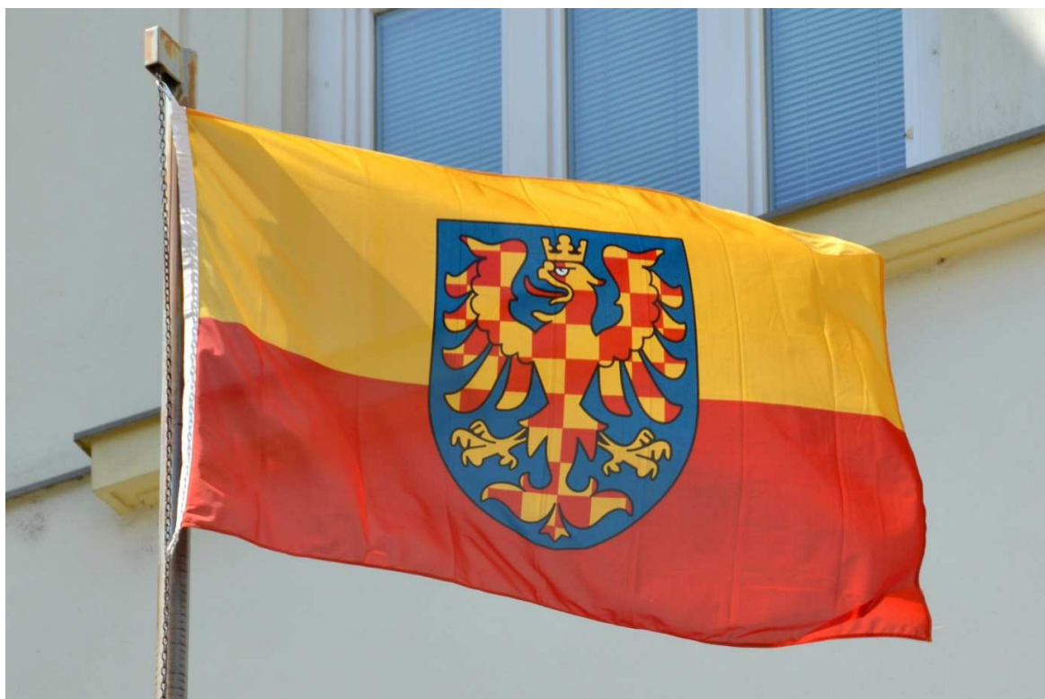
Obr. 2: Jedna z verzí moravské vlajky vyvěšované (nejen) 5. července

Na základě nezúčastněného pozorování mohu konstatovat, že uvedené počty zapojených obcí jsou pouze orientační, neboť ne vždy se shoduje seznam obcí (kde jsou zahrnuty i městské části a Krajský úřad Jihomoravského kraje), v nichž má 5. července zavlát moravská vlajka, se skutečností zaznamenanou v terénu. Na druhou stranu se lze v řadě obcí setkat s moravskou vlajkou i v jiné dny v roce (a to nejen ve zmíněné pro Moravu významné dny), což se v některých případech děje zásluhou jednotlivců, kteří si touto vlajkou zkrášlí prostor před vlastním domem. Důležité je poznamenat, že neexistuje jedna všemi uznávaná verze moravské vlajky, což nezřídka vede ke sporům mezi některými Moravany. Často používaná varianta, kterou v podstatě doporučuje i Moravská národní obec, je zachycena na Obr. 2 (fotografie byla pořízena v městské části Brno-Královo Pole). Díky pozorování mohu rovněž konstatovat, že při vytváření Moravy (a jiných regionů) se uplatňuje také relační přístup (viz kapitola 2.3). Například v září 2016 v Brně spolupřádala politická strana Moravané konferenci Evropské svobodné aliance ( European Free Alliance , dále jen EFA), kde si zástupci různých subjektů (nejen členů EFA – zastoupena byla např. i Moravská národní obec) předali zkušenosti s organizací různých aktivit podporujících „své“ regiony. EFA tedy představuje jakousi síť vztahů propojující různé subjekty, čímž přispívá k vytváření a přetváření regionů.