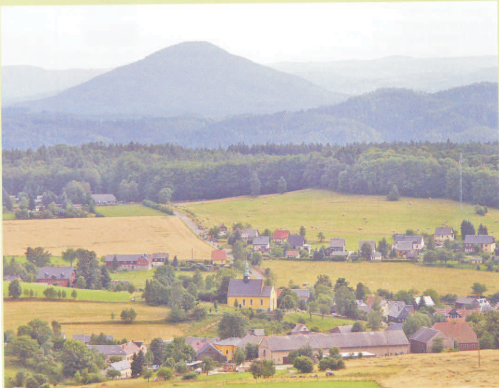
Obr. 1: Pohled na Hinterhermsdorf v německo-českém příhraničí.