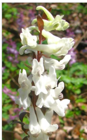
Barevná rozmanitost dymnivky duté

Během každoročního jarního probouzení přírody se ve zdejším lese opakuje úžasné barevné divadlo. Během jednoho z nejnápadnějších a nejpůsobivějších projevů naší přírody zde zpravidla již od konce března do poloviny dubna rozkvétá řada barevných květů bylinného patra. Mnohde v nejrůznějších barevných kombinacích, mnohde v zahuštěných přebohatých porostech. Převážně nápadně kvetoucí lesní rostliny využívají přechodného období nástupu jara s dostatkem pronikajících slunečních paprsků ještě před olistěním stromů, které posléze vytvoří zcela jiné stinné prostředí. Bohatost a druhá skladba bylinného patra dokládá, že zde lesní prostředí existuje již po celá staletí.