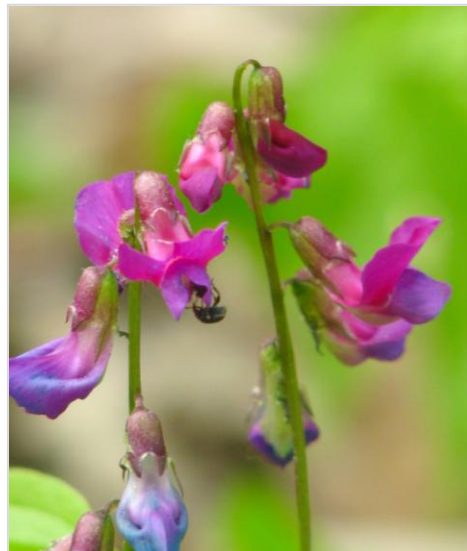
Lecha jarní ( Larhirus vernus ) roste ve Velkém hájku stejně ojediněle jako prvosenka