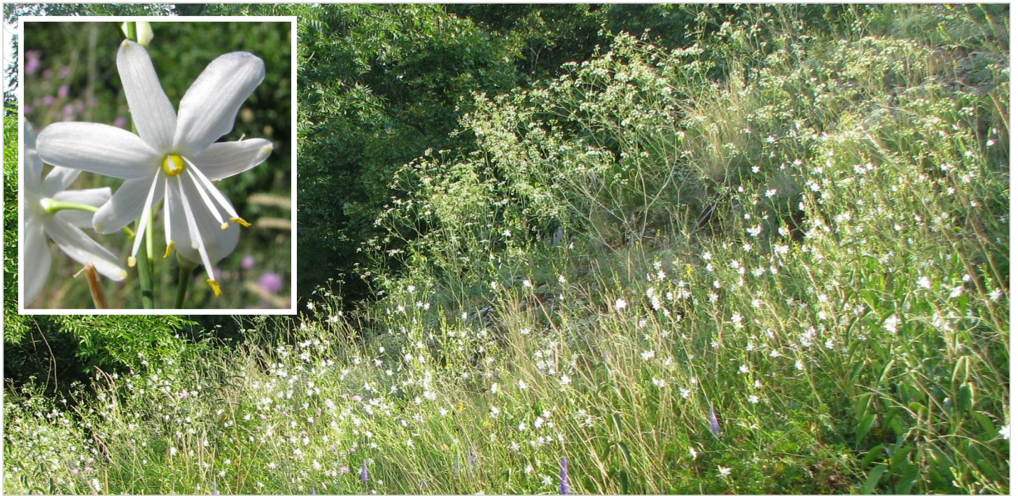
K rozkvětu bělozářek větvnatých dochází až v hlubokém létu během července