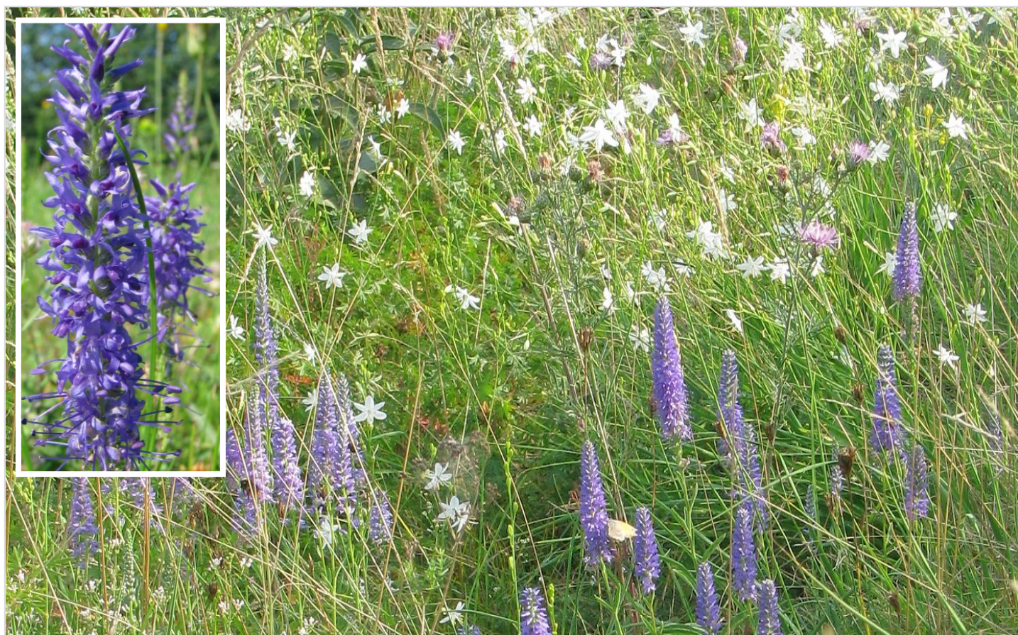
Rozrazilky klasnaté jdou do květu již v době bělozářek, ale k maximu dochází zpravidla až začátkem srpna.