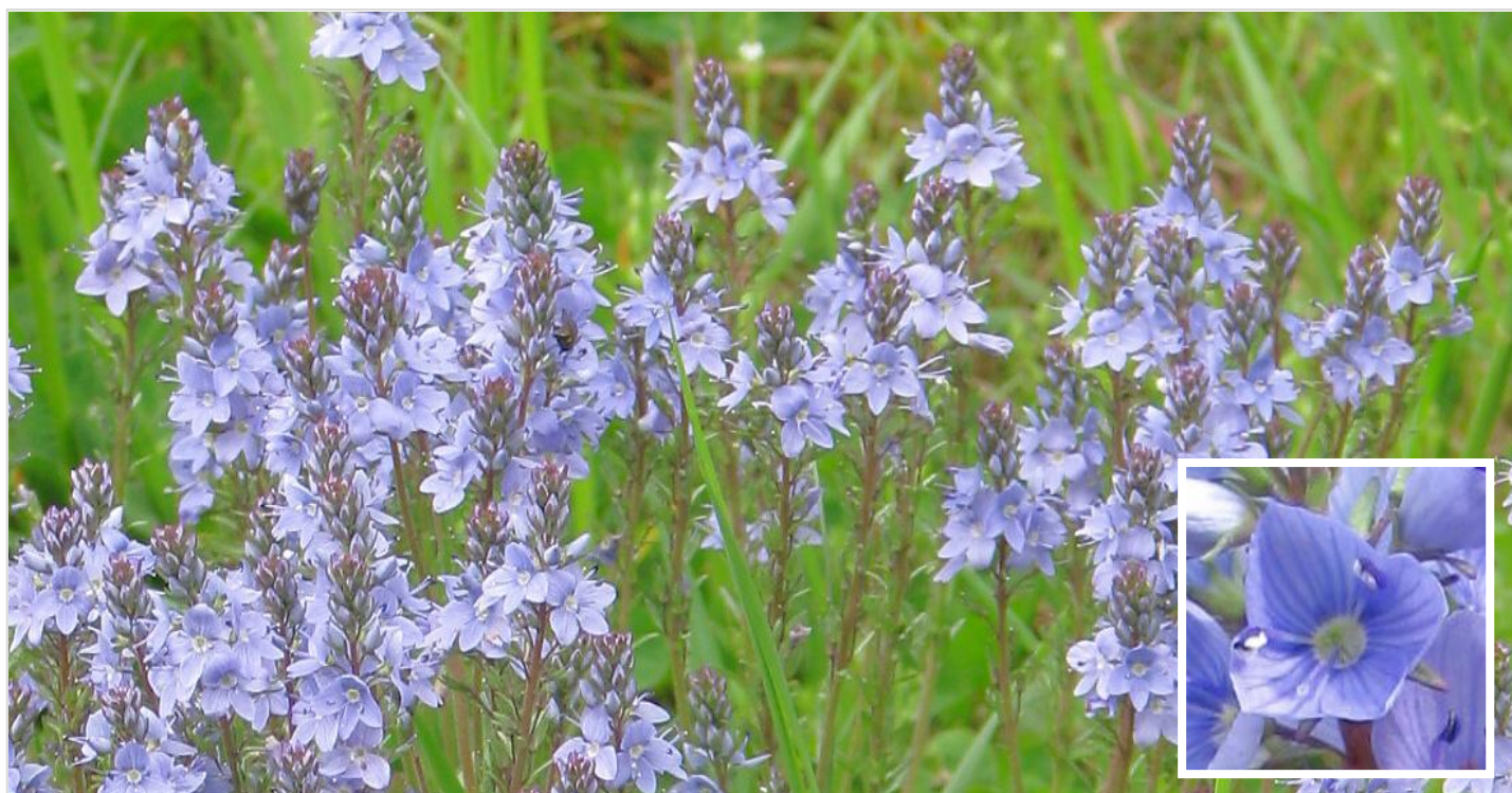
Rozrazil rozprostřený vykvétá během druhé poloviny dubna