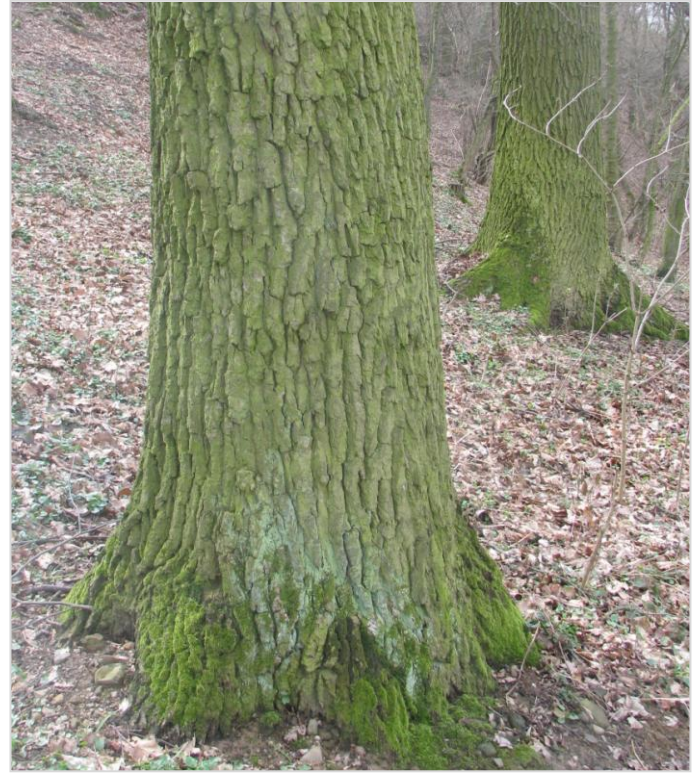
Mohutné duby rostou třeba na temeni podél pěšiny nebo v úpatí severních svahů.

Charakteristický je pro zdejší les výskyt četných staletých mohutných dubů letních dosahujících průměrů kmene až kolem jednoho metru a výšky přes 25 metrů. Zvláště v mimovegetačním období, ale i v době plné vegetace jsou některá místa díky staletým dubům neobyčejně působivá.