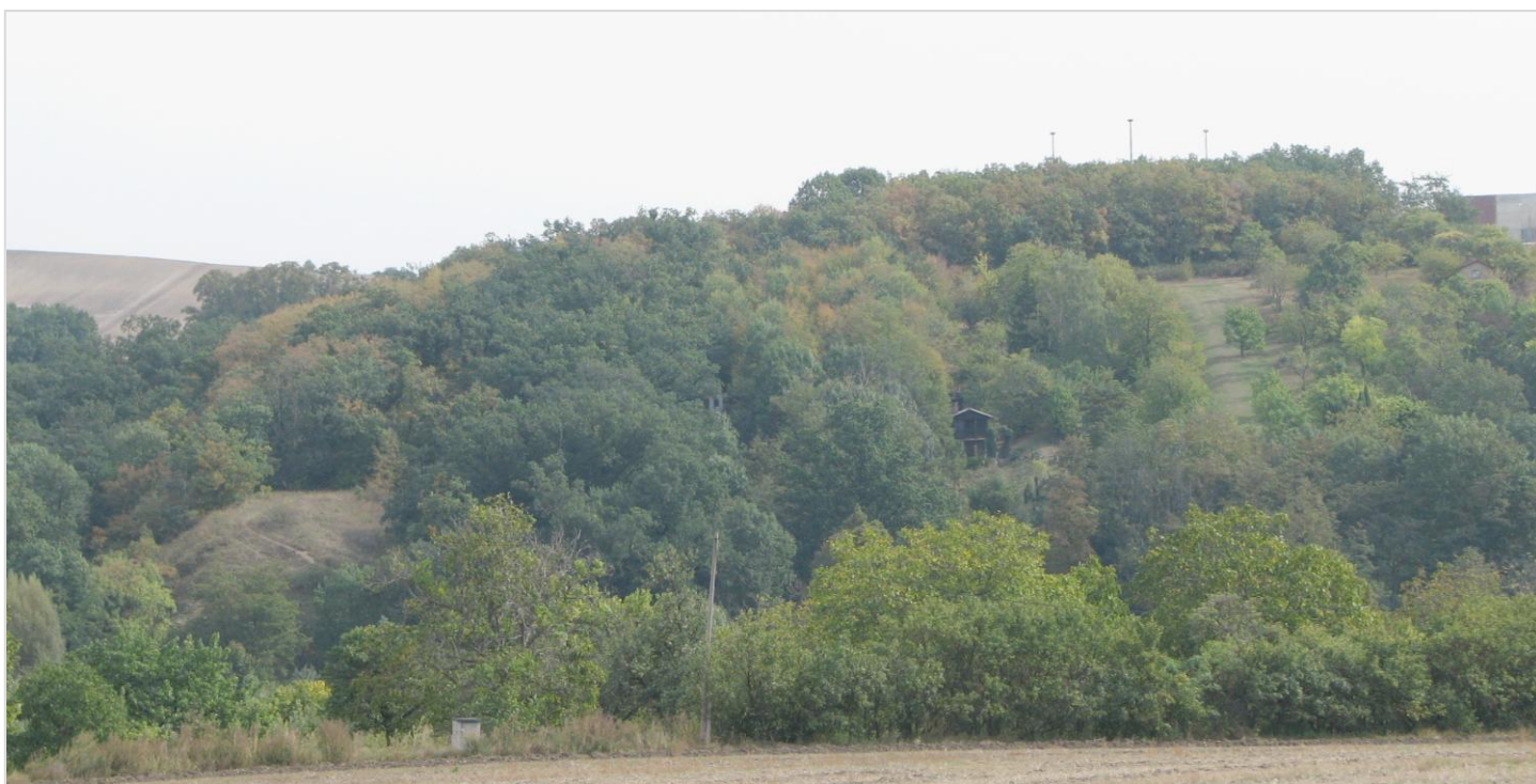
Pohled od západu, vlevo dole světlna nad silnicí, vpravo nahoře areál cihelny

Ještě v roce 1866 byl Hájek popisován jako travnatá a pomístně křovinatá stráž s osamocenými duby. Patrně však nemalé partie temene či severních svahů měly tradiční podobu lesa, byť snad značně prořídleho či omlazujícího. V roce 1953 již byla celá západní část porostlá zapojeným lesním porostem. Pouze světlna nad silnicí zůstávala otevřeného charakteru. Celá východní horní část, v sousedství dnešní cihelny, byla ještě zemědělsky obdělávána. Někdy po roce 1955 došlo k jejímu zalesnění dubem. Zvláště po obvodu lesního porostu v sousedství cihelny docházelo v následujících desetiletích k výsadbám některých cizorodých druhů jako je pámelník bílý ( Symphoricarpos rivularis ) nebo šerík obecný ( Syringa vulgaris ). V roce 1992 se již lokalita potýkala s některými problémy. Okrajové partie světliny nad silnicí byly plošně atakovány spontánním rozšiřováním porostů trnky obecné ( Prunus spinosa ) a náletu jasanu ztepilého ( Fraxinus excelsior ). Po značných plochách lesa byl zapojený keřový podrost bezu černého ( Sambucus nigra ). Podobně v horní relativně ne-