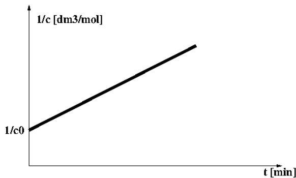
Obrázek 2: Graf rychlosti chemické reakce pro reakci 2. řádu

Pro vytvoření grafu bude výhodnější na osu y vynést hodnoty \frac{1}{c} než hodnoty koncentrace c .