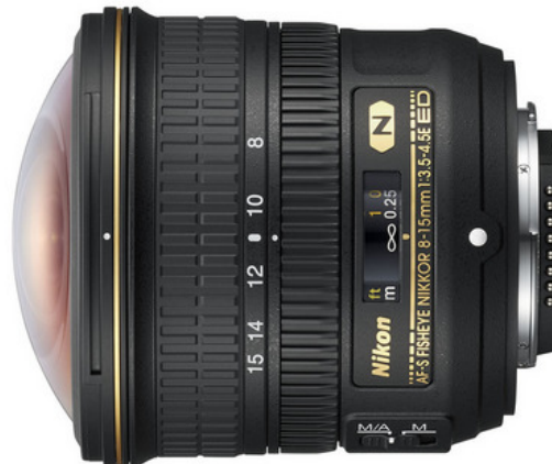
Nikon 8–15 mm f/3,5–4,5E ED

Viz též u fotoaparátů širokoúhlý objektiv (předsádka, adaptér) typu rybí oko: