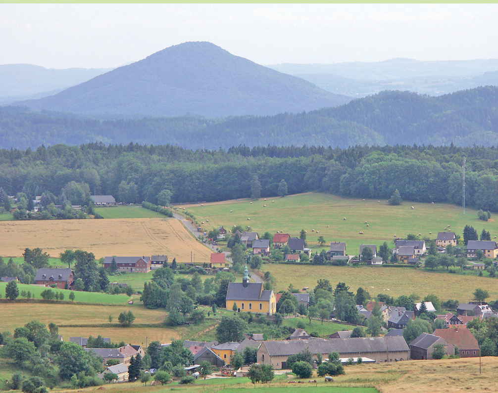
Obr. 1: Pohled na Hinterhermsdorf v německo-českém příhraničí.