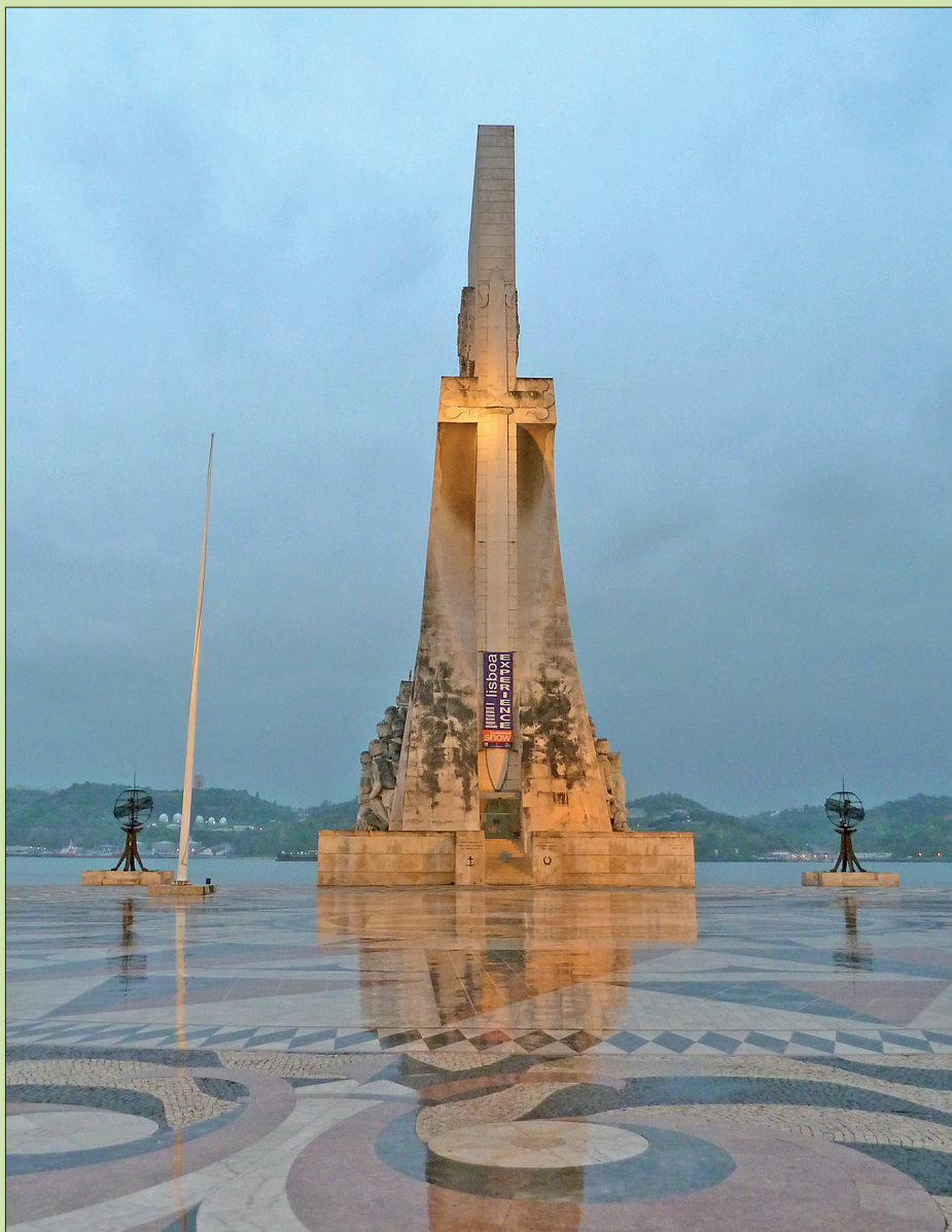
Obr. 3: Památník objevitelů v Lisabonu.

měřených oborů. Přibližně od 80. let 20. století můžeme v humánní geografii pozorovat nárůst zájmu o problematiku kultury a souvisejících společenských témat. Pro tuto změnu v myšlení, typickou nejen pro humánní geografii, ale též další společenské vědy, se vžilo označení „kulturní obrat“ nebo také „sociální obrat“ (srv. Werlen 2003). Ten se nejprve projevil ve více teoreticky zaměřené geografii britské a posléze i americké. Od počátku 90. let 20. století jsme však svědky pronikání těchto přístupů i do dalších národních geografických škol, např. německé (Blotvogel 2003; Lossau 2008) či francouzské (Claval, Staszak 2008; Claval 2008; Di Méo 2008). A přestože byl v geografii „obrat ke kultuře“ některými autory kritizován za přílišné teoretizování a nedostatečný příspěvek k aplikaci geografických poznatků (Barnett 2004; Martin 2001), lze jeho přínos spatřovat především v rozvoji kritických přístupů k poznávání okolního světa (Blotvogel 2003), tedy kompetencí