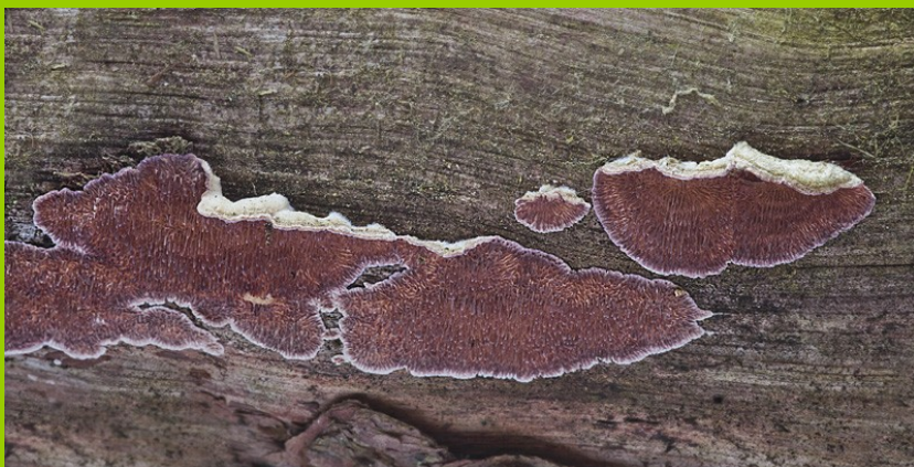
(nahore detail čerstvé plodnice)