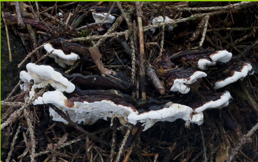
(nahore pravý k. vrstevnatý, preferující borovice, dole dnes odlišovaný druh kořenovník smrkový – H. parviporum )