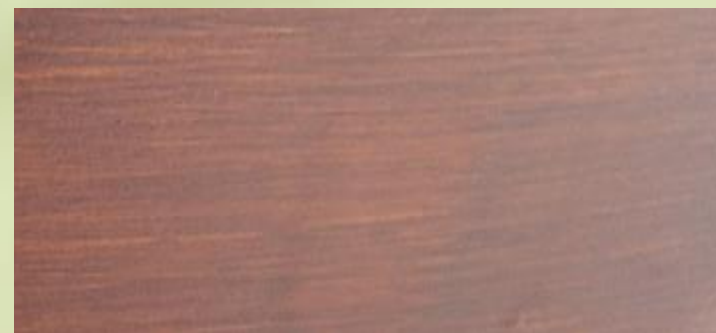
Lak – výsledný povlak (povrchová úprava)