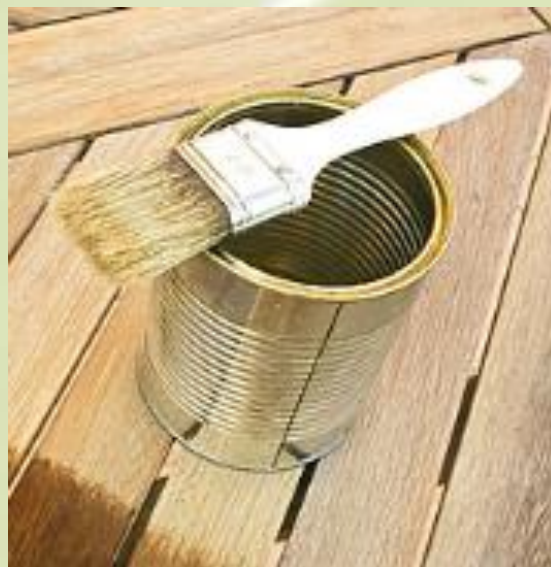
lak – výrobek