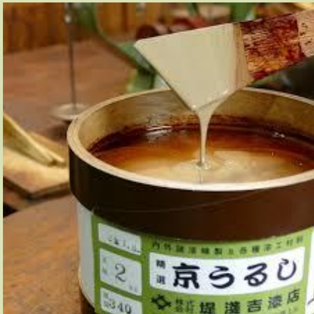
lak Lacca urushi