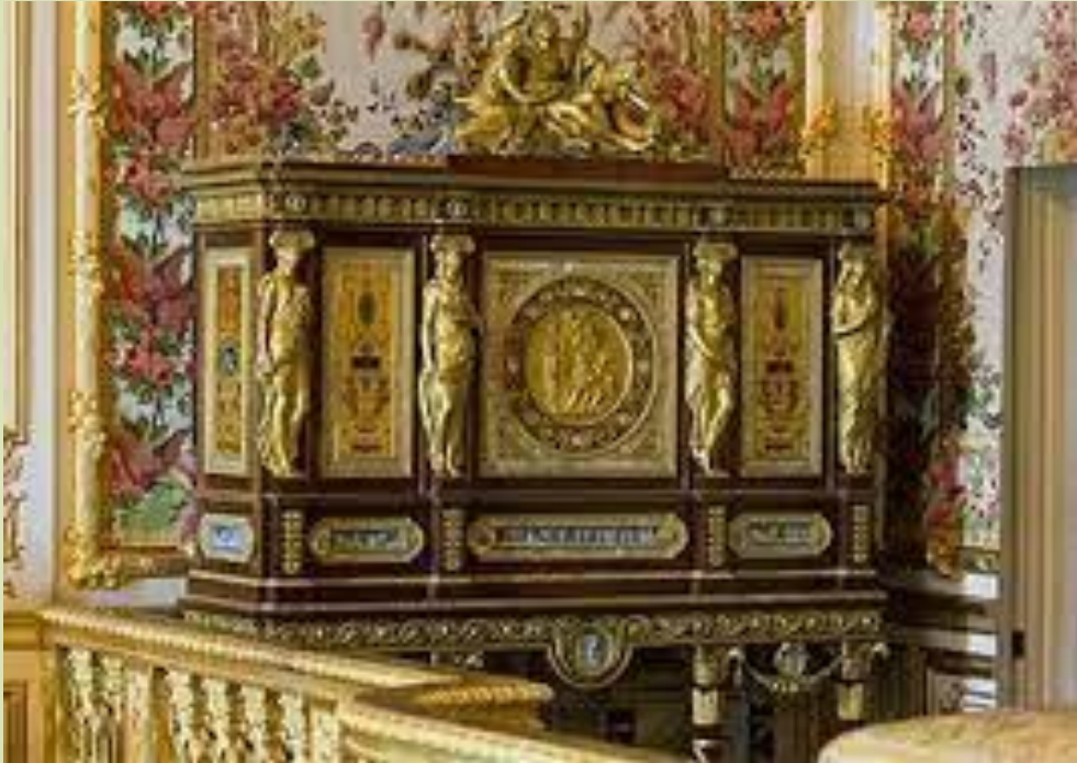
Martin's Varnish – lak podle Martina FRANCIE – ZÁMEK VERSAILLES

A TREATISE ON THE COPAL OIL VARNISH or, what in FRANCE is call'd VERNIS MARTIN