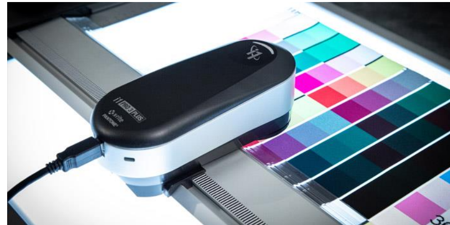
Obr. 4: Kalibrační zařízení