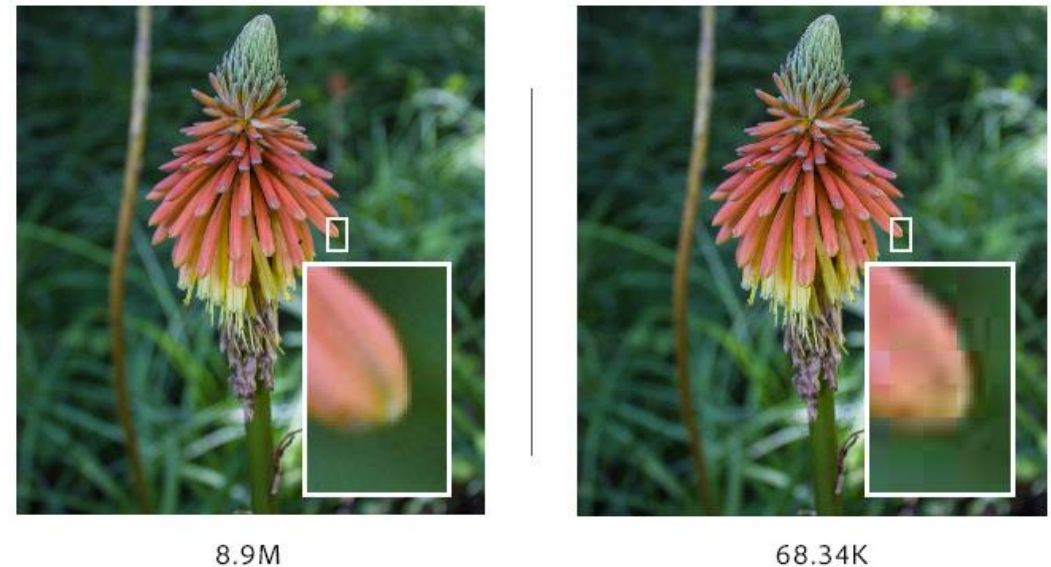
Obr. 3: Rozdíl v kompresi obrázku