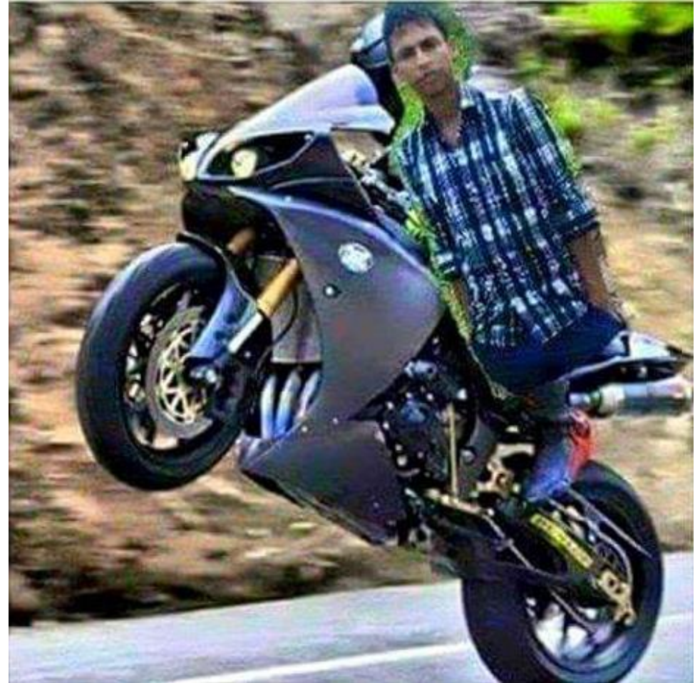
Obr. 2: Jak (ne)editovat bitmapovou grafiku