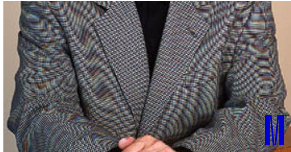
Obr. 5: Moaré v obrázku