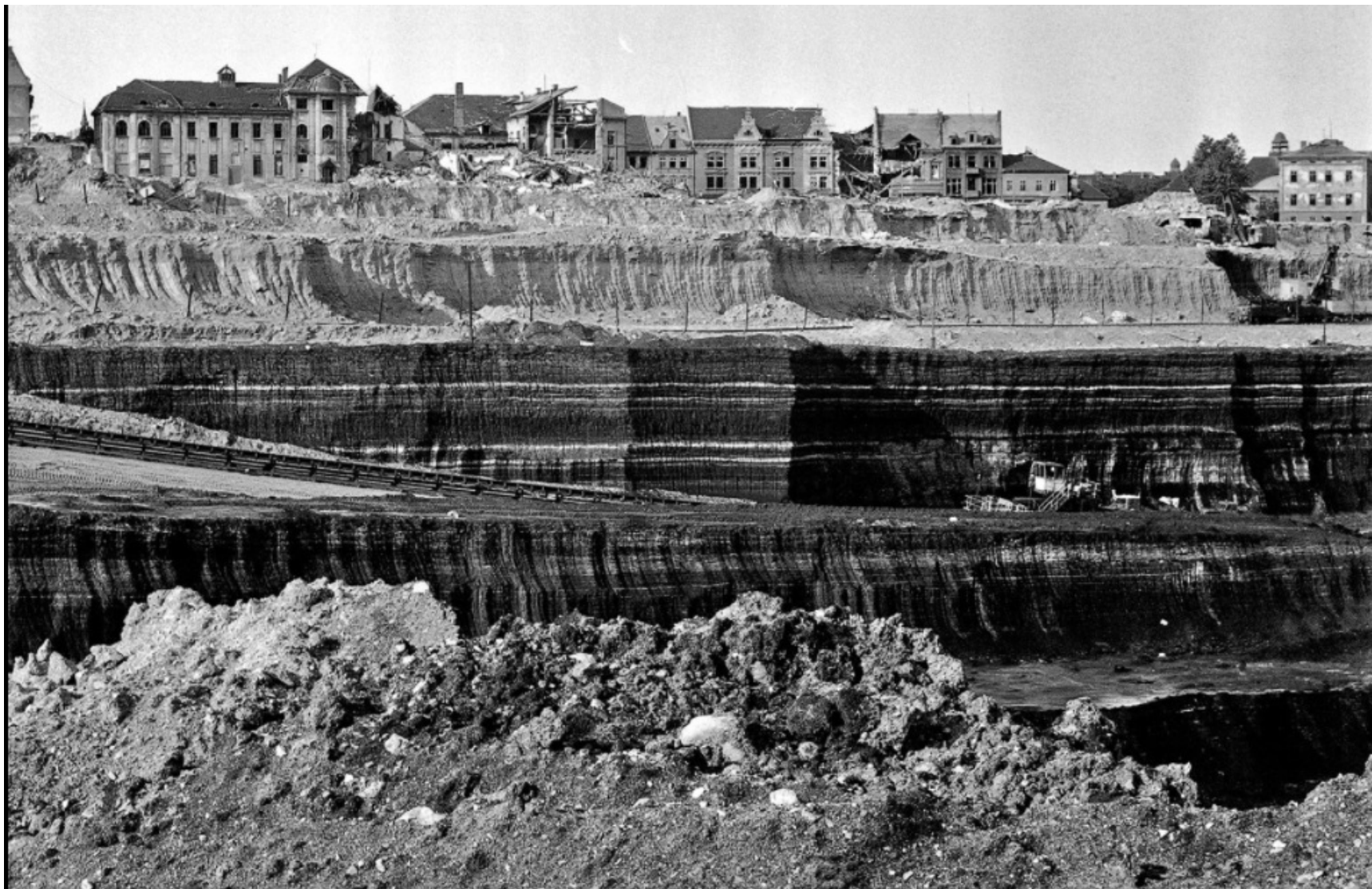
Zbytky historického Mostu, který musel ustoupit povrchové těžbě hnědého uhlí. (září 1975)