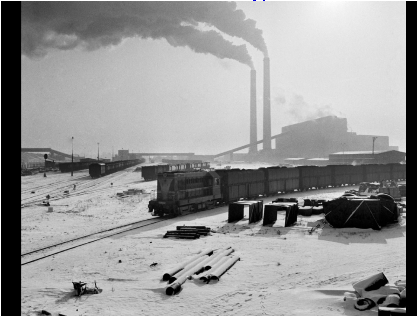
Uhelný vlak před tepelnou elektrárnou v Opatovicích nad Labem (23. ledna 1963)