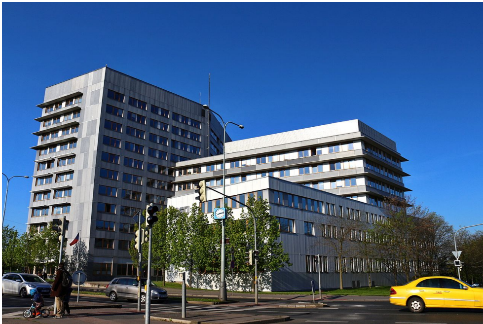
Obrázek 1: Sídlo ČSÚ v Praze (rok 2017).

Český statistický úřad (ČSÚ) byl zřízen v roce 1969 a jako hlavní orgán státní statistické služby se zabývá získáváním údajů, zpracováváním, vytvářením a zveřejňováním statistických informací o různých aspektech vývoje České republiky a jejích částí. Na oficiálních stránkách ČSÚ ( https://www.czso.cz/ ) tak můžeme zdarma nalézt grafy a tabulky shrnující např. populační vývoj, volební statistiky, dopravní nehodovost, vývoje cen bytů a vývoj nezaměstnanosti. Jeden z grafů budeme analyzovat v následujících úloze.