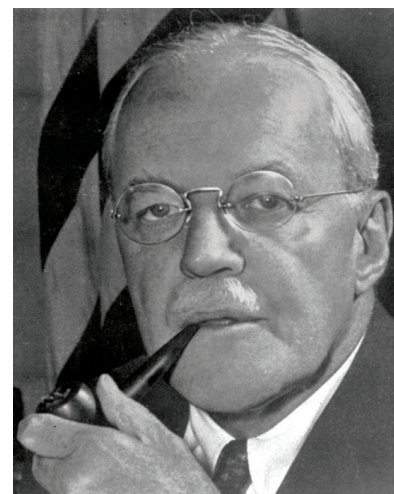
Allen Dulles, šéf CIA

Tlak na Kennedyho ze strany zpravodajských služeb vrcholil koncem března 1961. CIA ho neustále zásobo-