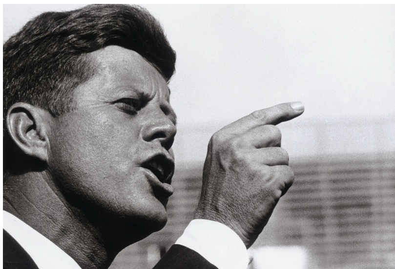
Americký prezident John F. Kennedy v roce 1960