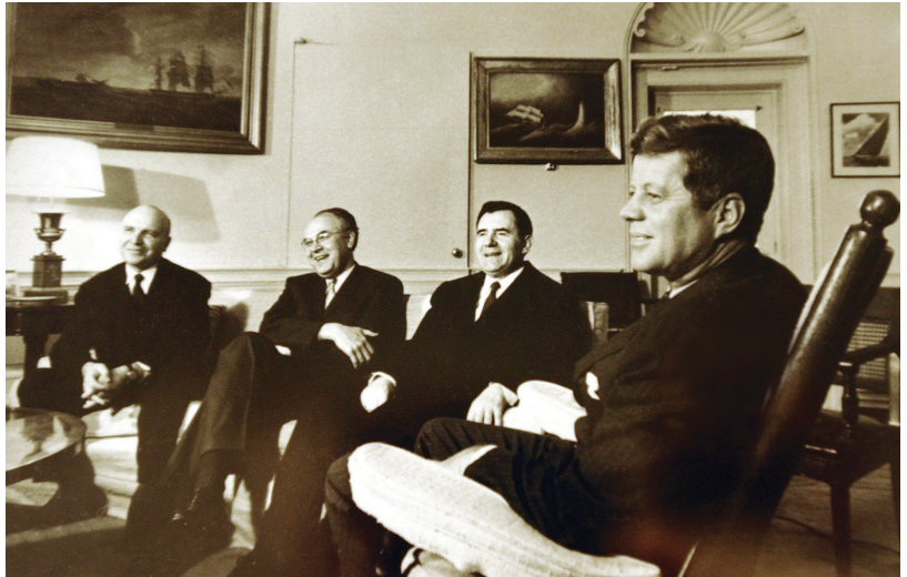
Prezident Kennedy během schůzky se sovětským velvyslancem Andrejem Gromykem (druhý zprava) v Oválné pracovně Bílého domu, 18. října 1962

Asi měsíc byly intenzivně shromažďovány zprávy o sovětském chování na Kubě. Kennedy kličkoval mezi rozvahou a odhodláním zasáhnout, až v polovině října špionážní letoun U-2 a satelit Samos přinesly nezvratné důkazy o budování odpalovacích ramp na Kubě a jejich zásobení raketami, na snímcích pěkně čitelnými, protože byly v horizontální poloze. Kennedy byl o těchto snímcích oficiálně informován 16. října, a i když se je v úzkém kruhu spolupracovníků pokusil zpochybnit (na snímcích je