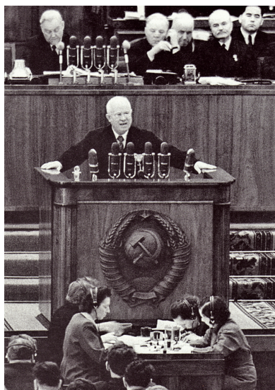
První tajemník ÚV KSSS N. S. Chruščov na tribuně XX. sjezdu KSSS

Repro: N. S. Chruščov, Vospominanija – vremja, ljudi, vlast'