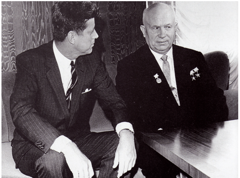
J. F. Kennedy a N. S. Chruščov během jednání ve Vídni v červnu 1961