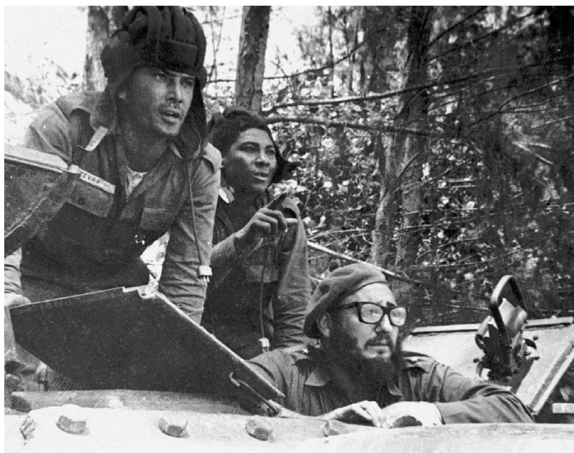
Kubánský vůdce Fidel Castro (vpravo) v tanku nedaleko Zátoky vepřů, kde v dubnu 1961 probíhala operace na odvrácení invaze 1400 kubánských emigrantů

mován a rozmístil svá letadla po nejručnějších místech své země, takže letecký útok vlastně nesplnil cíl. Bylo zničeno pět letadel z pravděpodobných osm, které měl Castro k dispozici (někteří autoři udávají vyšší číslo, Dallek dokonce třicet 10 ) a plánovaný druhý nálet následující den již Kennedy nepovolil, ba výslovně zakázal. Castro totiž vyvolal lidové demonstrace protestující proti útokům ze vzduchu, slavnostně pohřbíval několik mrtvých, aktivoval celou armádu i lidové milice na obranu své revoluce a stěžoval si v Radě bezpečnosti OSN i u všech vlád světa. Právě to zastránilo Kennedyho, takže všechny další plánované formy podpory ze strany americké vlády stáhl.