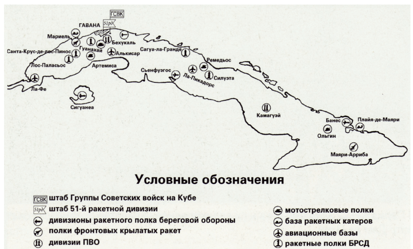
N. S. Chruščov během svého proslulého projevu na půdě OSN a schéma rozmístění sovětských vojenských objektů na Kubě v říjnu 1962