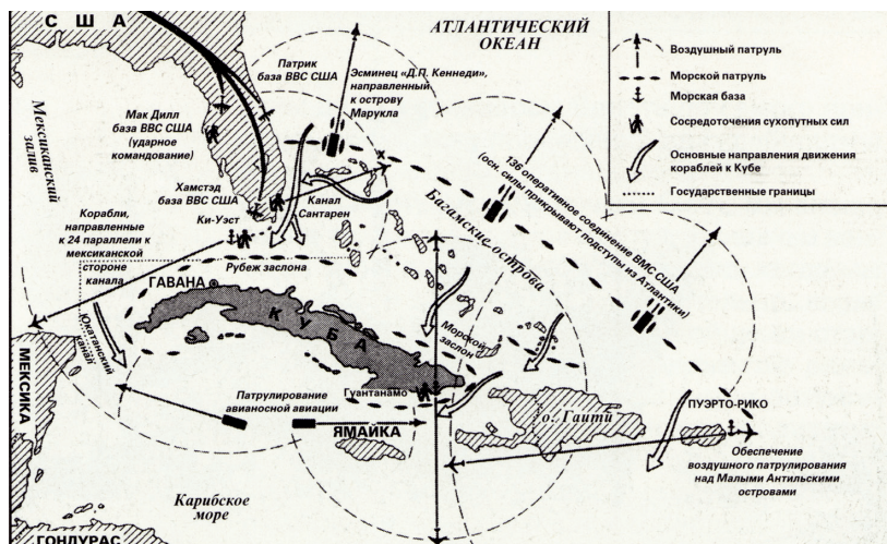
Jeden ze satelitních snímků z 3. října 1962, usvědčujících režim Fidela Castra z rozmístování raket středního doletu s jadernými hlavicemi na kubánském území, a americká námořní flotila u pobřeží Kuby, říjen 1962