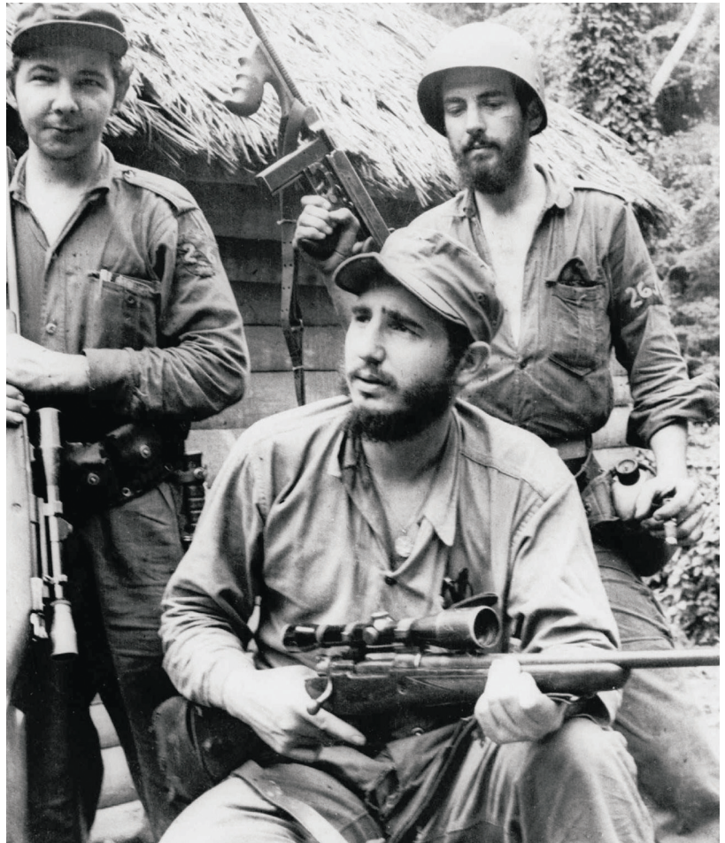
Fidel Castro (v popředí) v březnu 1957

Všichni odsouzení byli v roce 1955 předčasně propuštěni (Batista, znovu v prezidentském úřadě, vyhlásil všeobecnou amnestii), byli však vyhoštěni z Kuby. Castro po krátkém pobytu v USA skončil v Mexiku, kde se sblížil s Che Guevarou, argentinským komunistou, který ho naváděl k další čin-