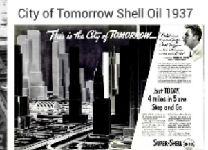
City of Tomorrow Shell Oil 1937 Just TODAY 4 miles in 5 sec Stop and Go SUPER-SHELL