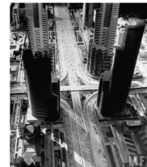
FUTURAMA 1939/1940 sponzorováno General Motors

Důvody podpory: nebezpečnost stávajících dálnic | časté zácpy | podpora podnikání snížením dopravních nákladů | možnost evakuace obyvatel velkých měst v případě jaderného útoku