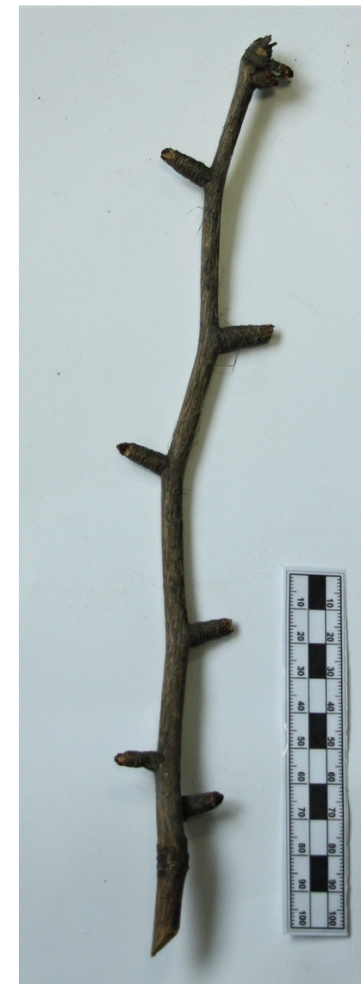
větvička s brachyblasty