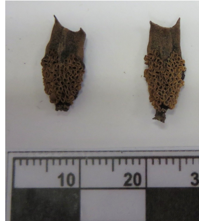
mikrosporofyly s četnými mikrosporangii