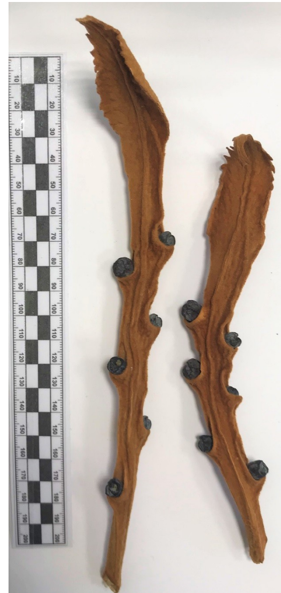
megasporofyl s nahými vajíčky