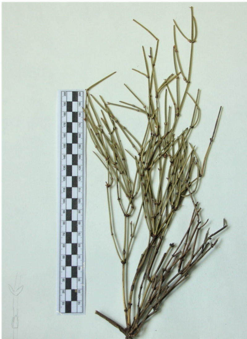
článkované lodyhy chvojníku