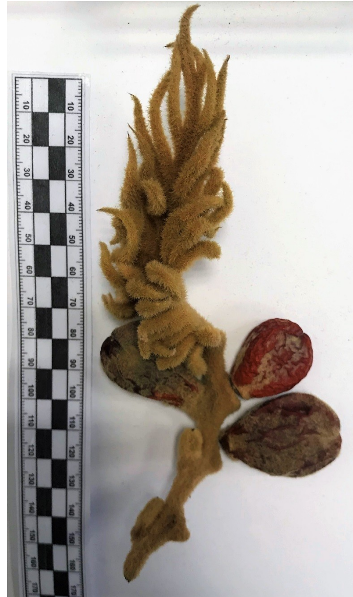
Cycas revoluta , samičí rostlina, megasporofyly uspořádány do chocholu