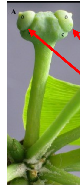
plochý megastrobilus nese dvě nahá vajíčka

https://www.sciencedirect.com/science/article/pii/S0367253021001900