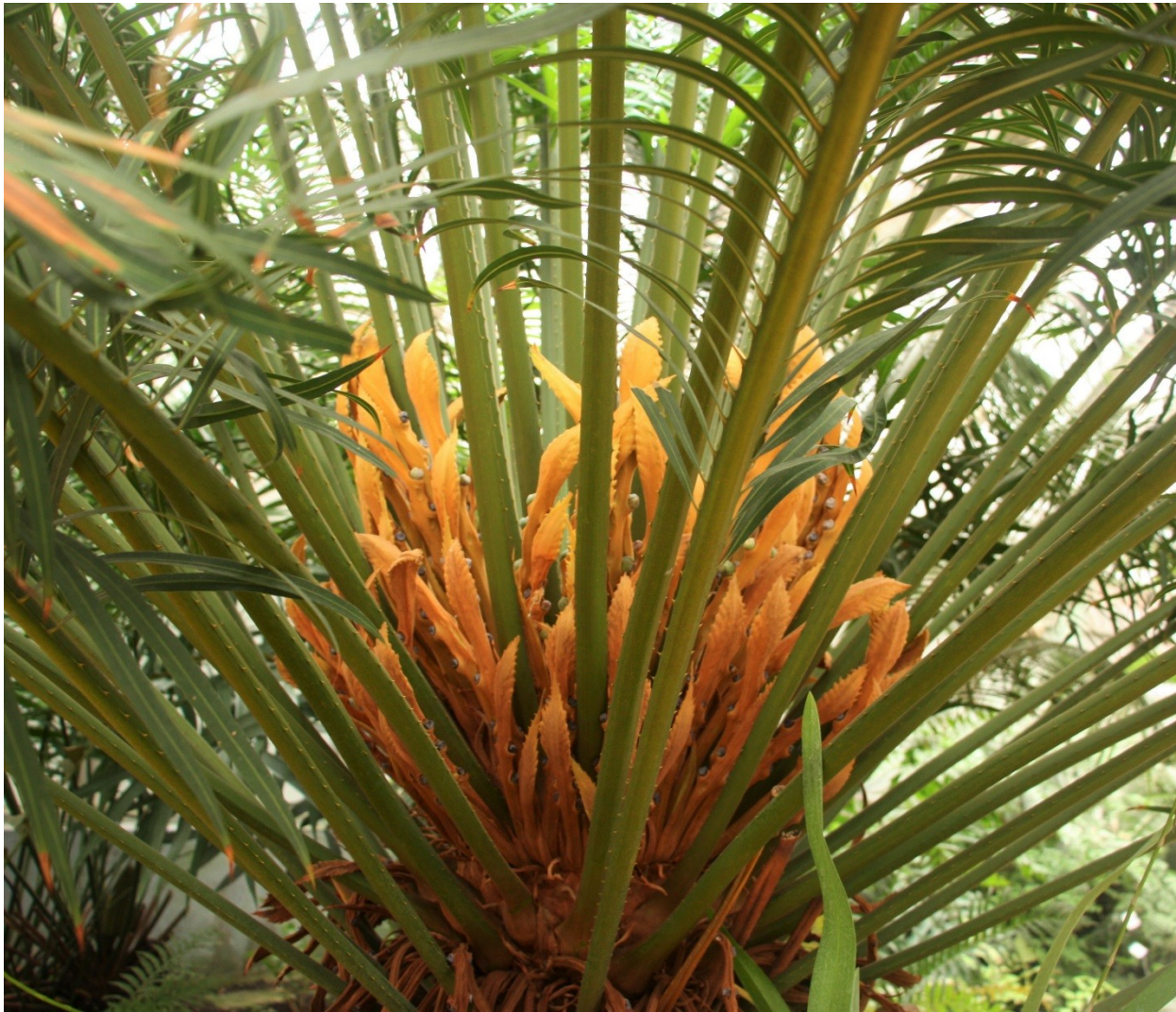
Cycas circinalis , samičí rostlina, megasporofyly uspořádaný do chocholu