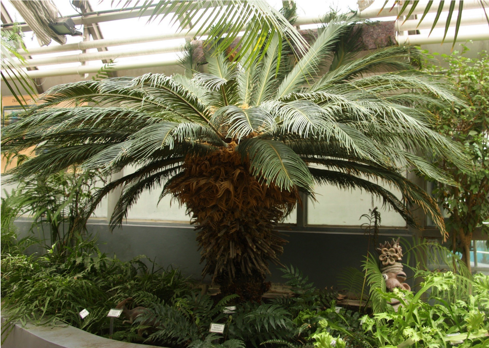
Cycas revoluta , samičí rostlina, trofofyly dělené, lístky listů čárkovité