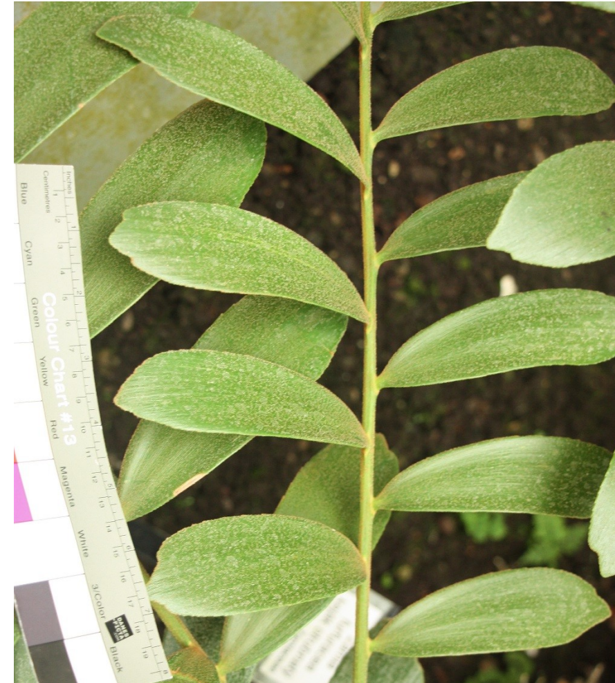
trofogyly dělené, lístky listů obkopinaté