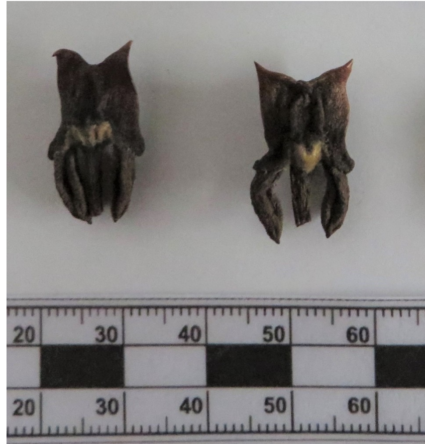
megasporofyly se dvěma nahými vajíčky