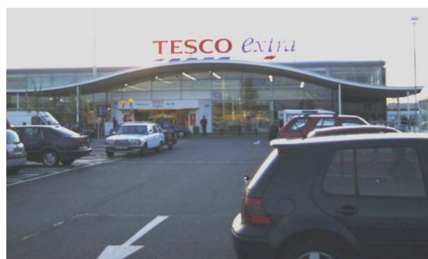
obr. 2, 3: téměř identická nákupní střediska v Maďarsku a Německu