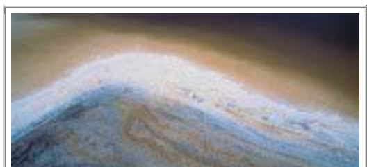
Chráněné území Wai-o-tapu Thermal Reserve se nachází v centru severního ostrova a je místem, které potěší nejen geologa, ale i každého člověka se smyslem pro krásu.

Vraťme se ale do Rotoruy. Zde jako by byly všechny problémy a nedorozumění zapomenuty. Podíl obyvatel maorského nebo smíšeného původu je tu velmi vysoký. Nahlédnout do jejich tradičního způsobu života je možné ve dvou původních vesnicích a také v Maori Arts and Craft Institute. Ten připomíná valašský skanzen v Rožnově pod Radhoštěm, s tím rozdílem, že zdejší Maorové mají poněkud jiné zvyky než pečení valašských frgálů. Obvyklou večerní zábavou organizovanou pro turisty je maorský koncert spojený s ochutnávkou hangi. Jedná se o tradiční maorské jídlo, které se připravuje v páře. Když jsou hosté dobře nakrmeni, mohou obdivovat hudební a taneční temperament domorodců. Blondaté Evropanky ječí nadšením, když jsou vtaženy do hry na pódiu, a fotoaparáty nestačí blikat. Atmosféru večera završují vzájemné doteky nosů, maorský pozdrav zvaný hongī, jímž se prý utvrzuje a zabezpečuje přátelství.