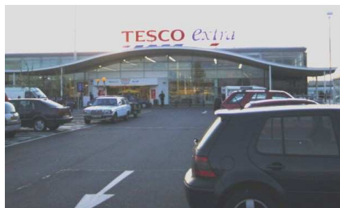
obr. 2, 3: téměř identická nákupní střediska v Maďarsku a Německu