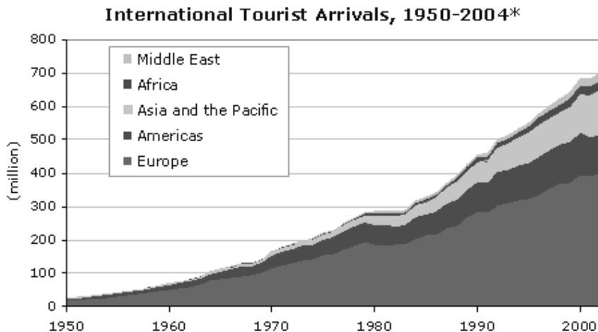
Obr. 1: Počet mezinárodních turistických příjezdů