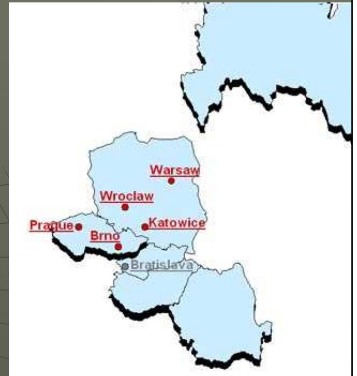
Centrální a východní Evropa