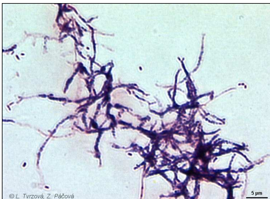
Nocardia carnea CCM 2756 Gramovo barvení, médium č.8, 30°C, 3 dny