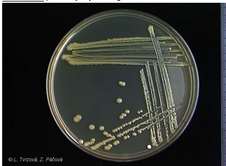
Corynebacterium glutamicum CCM 2428 médium č.1, 30°C, 48h.