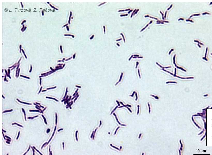
Rhodococcus erythropolis CCM 277 Gramovo barvení, médium č.1, 30°C, 2 dny.