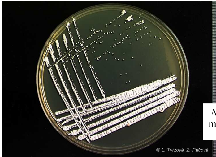
Nocardia carnea CCM 2756 médium č.8 (Yeast-Glucose agar), 30°C, 5 dní.

Výskyt a význam: půda, voda, živočichové