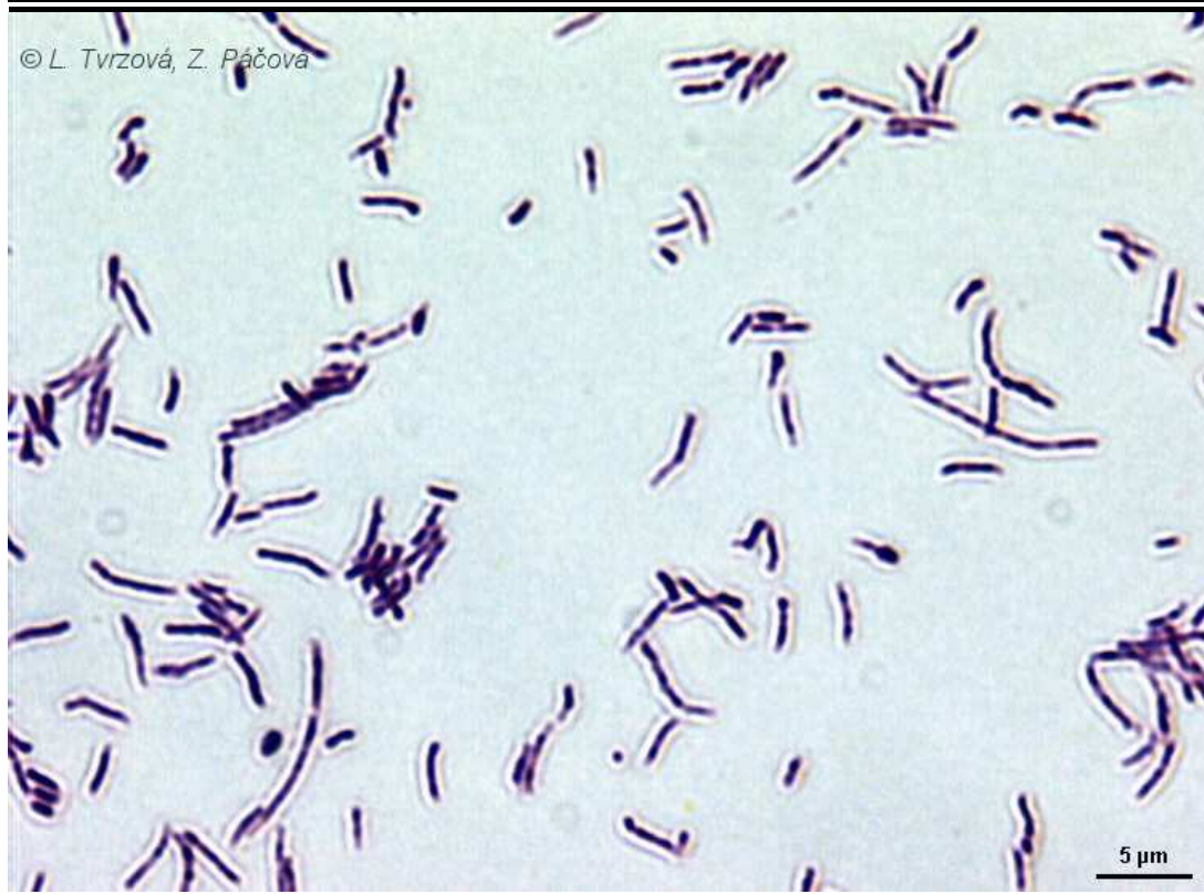
Gramovo barvení – 2dny, medium 1