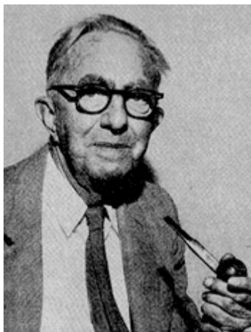
Frank Wilcoxon (1892 – 1965): Americký statistik a chemik

Nechť X_1, \dots, X_n je náhodný výběr ze spojitého rozložení s hustotou \varphi(x) , která je symetrická kolem mediánu x_{0,50} , tj. \varphi(x_{0,50} + x) = \varphi(x_{0,50} - x) . Nechť c je reálná konstanta.