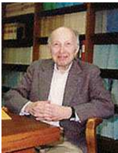
William Kruskal (1919 – 2005): Americký matematik