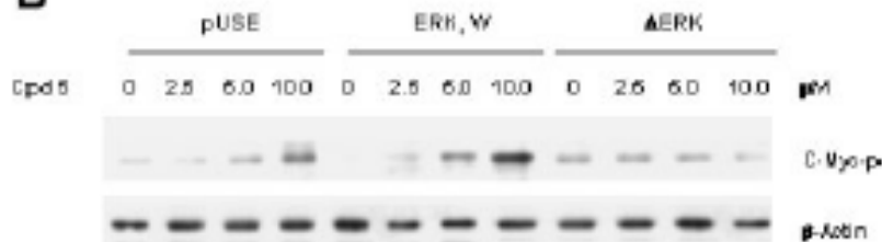
Fig. 2. Cpd 5-induced c-Myc phosphorylation is antagonized by phosphorylation sites mutated ERK. A: Hep3B cells were transfected with vector plasmid pUSE, wild-type ERK or mutated ERK (T188A/Y190F) cDNA, and treated with or without Cpd 5 (10 μM) for 1 h. Cell cytosol or nuclear extracts were immuno-blotted with anti-phospho-ERK or ERK2 antibody. B: Hep3B cell transfection is same as in (A), and transfected cells were treated with Cpd 5 (2.5–10 μM) for 1 h. Cell lysates were immuno-blotted with anti-phospho-Myc or anti-β-Actin antibody.