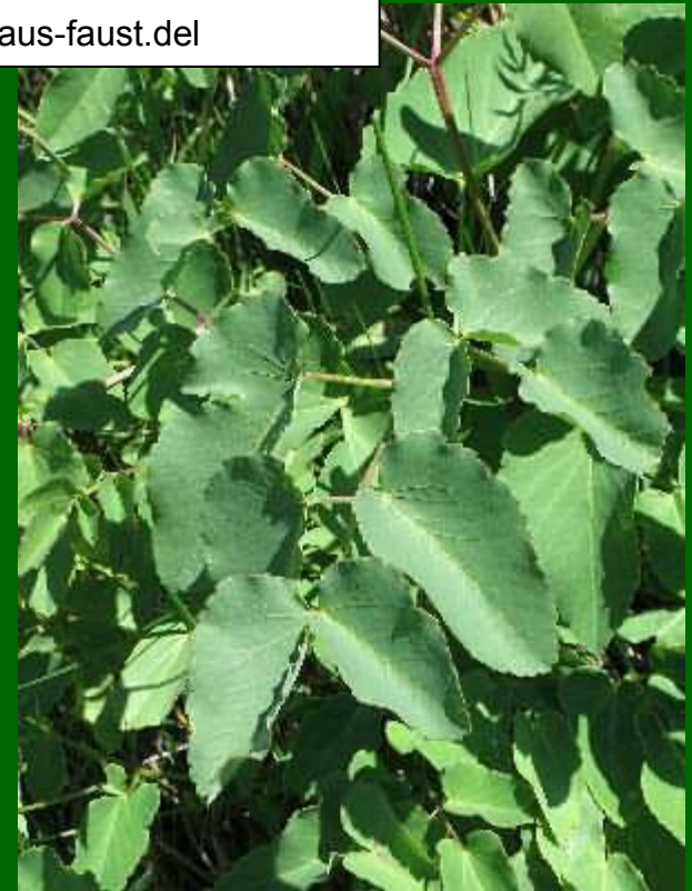
Laserpitium latifolium www.flogaus-faust.de