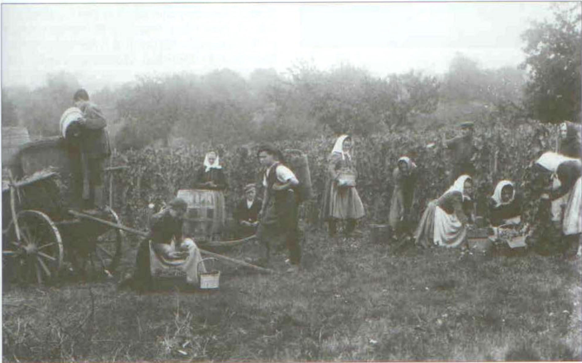
31 Vinobraní ve Strážnici. Foto J. Chlud 1910.