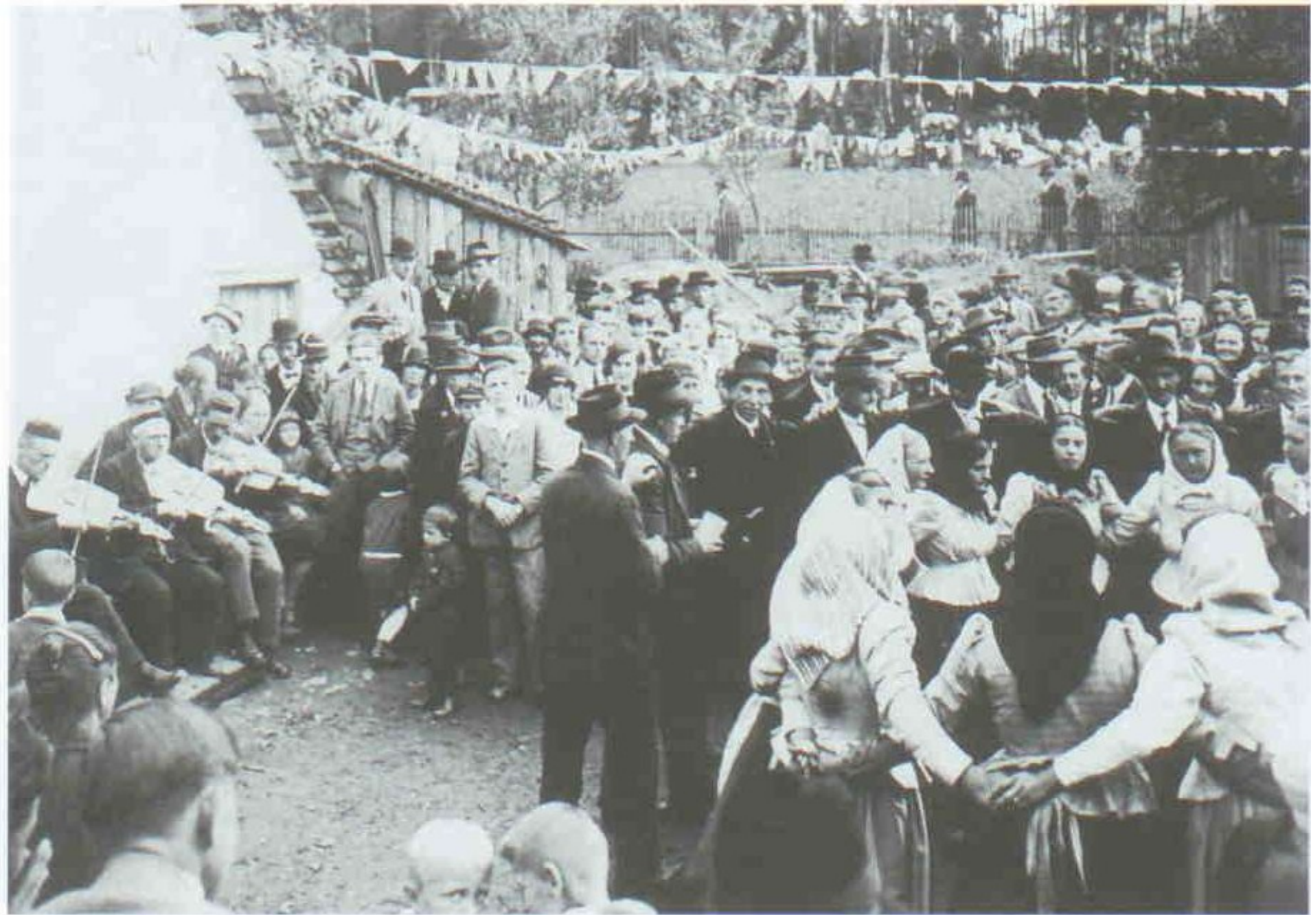
321 Kolo na lidové slavnosti u hostince Zum Eisenhammer na okraji Jihlavy, asi 1910. Horácko.