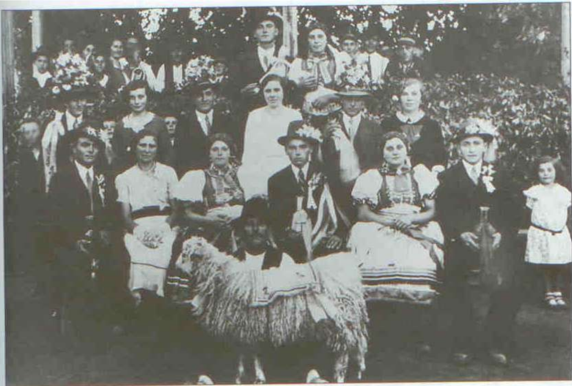
214 Hody (kirito) moravských Charvátů ve Frélichově (nyní Jevišovka) v roce 1931.