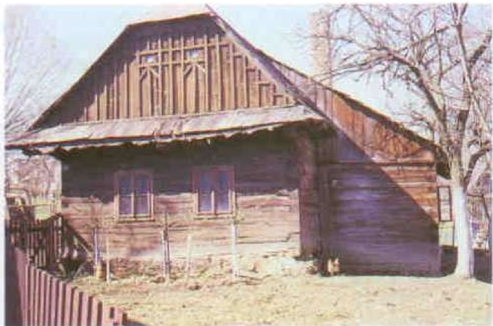
97 Valašský roubený dům z roku 1879, Poteč u Valašských Klobouk.