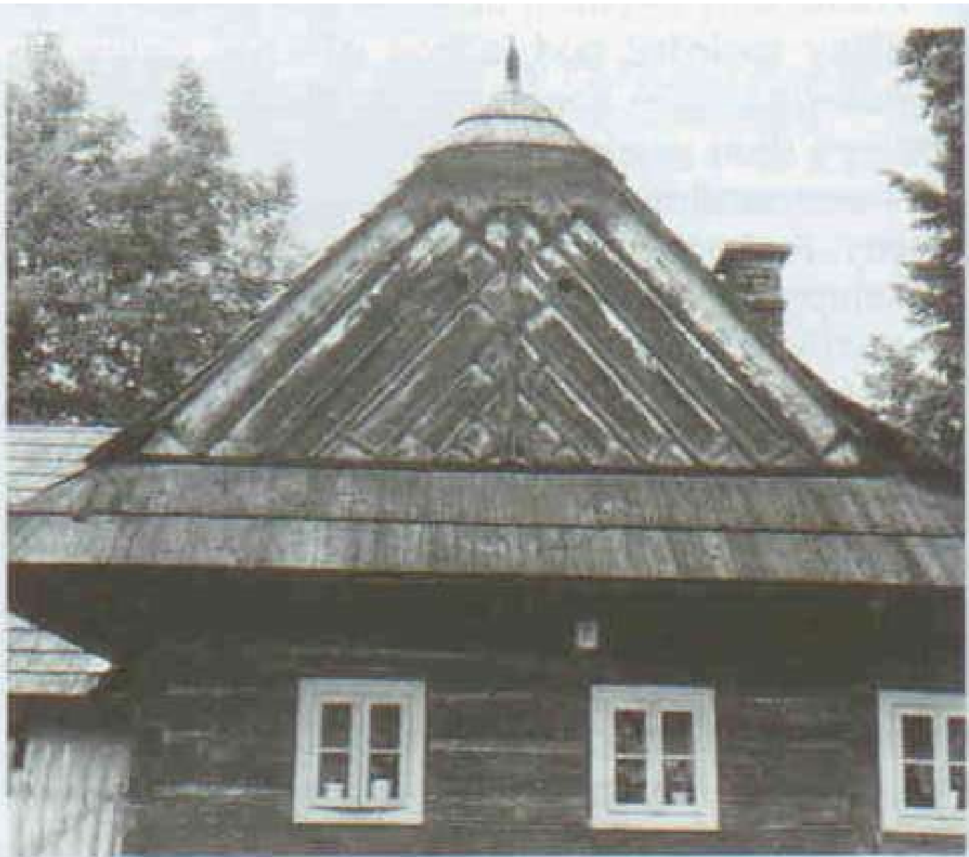
102 Štít valašského domu s datací 1872. Seninka č. 7. Foto R. Jeřábek 1970.