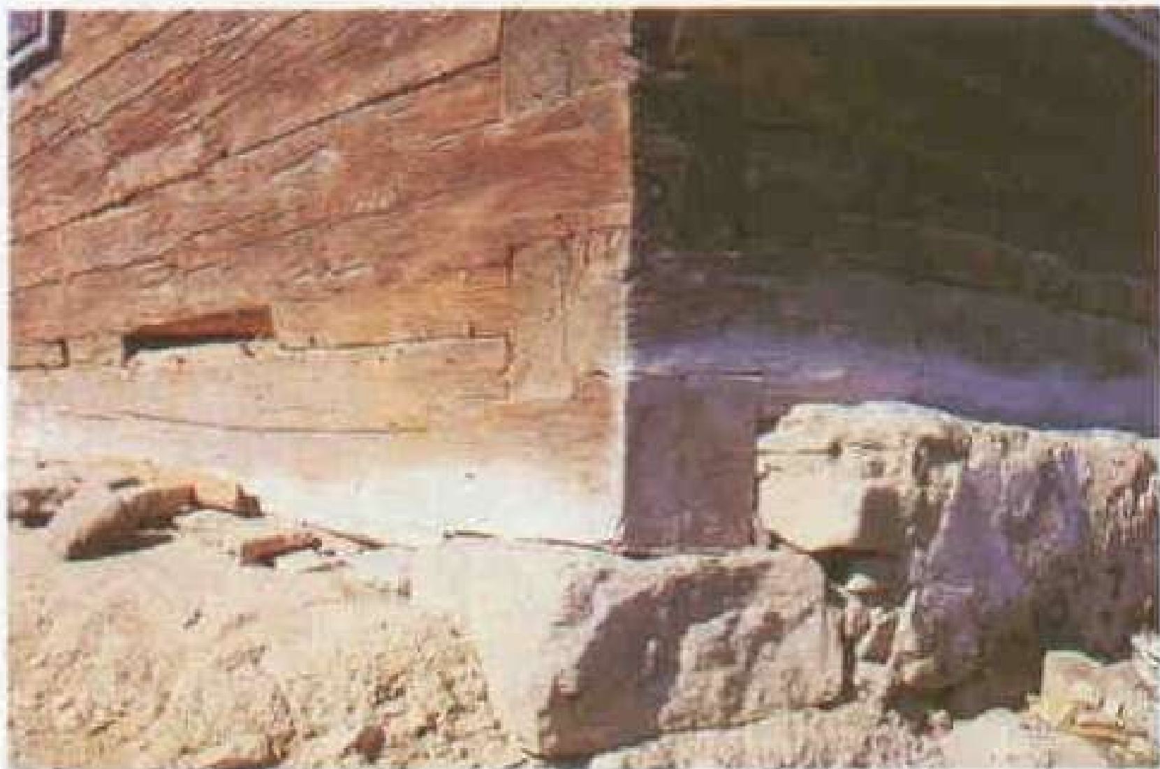
98 Konstrukce nároží roubeného domu z roku 1857. Poteč u Valašských Klobouk.