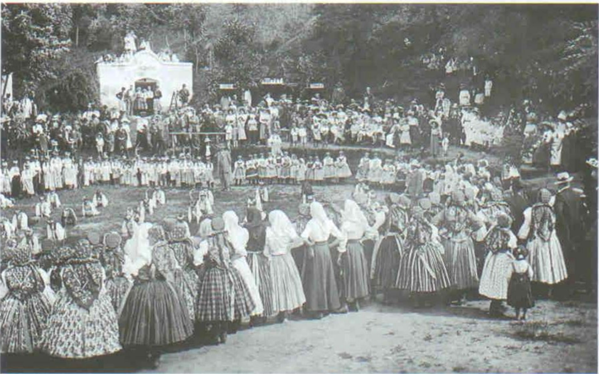
322 Folklorní slavnost. Plže u Petrova. 30. léta 20. století.