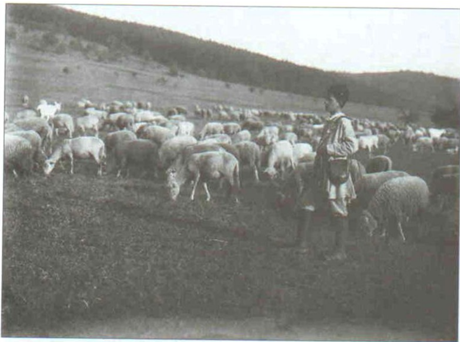
43 Pasáček ovcí v Javorníku. kolem r. 1910.