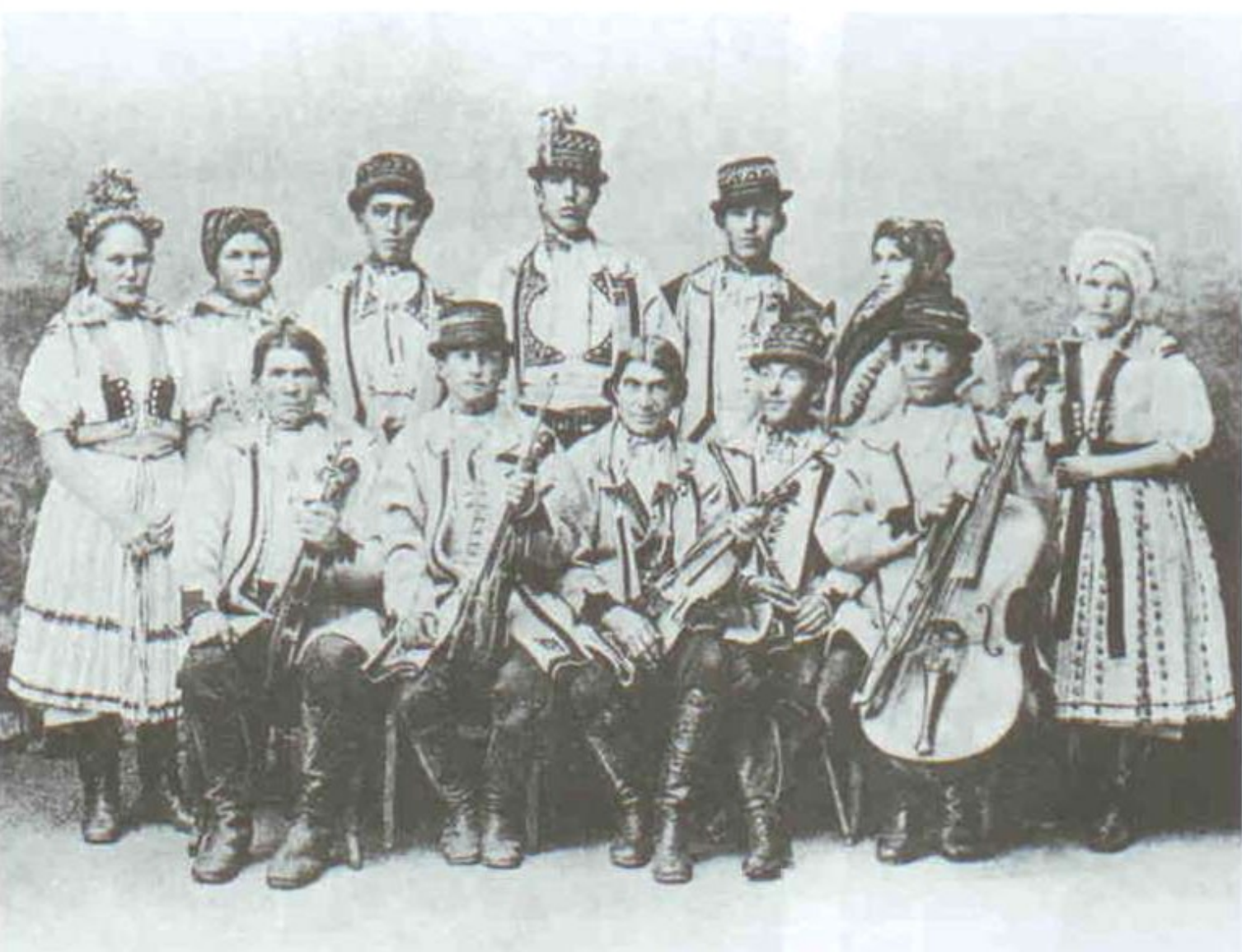
293 Hornáčekti hudeci a taněčníci na Lidovém koncertě v Brně, 1892.