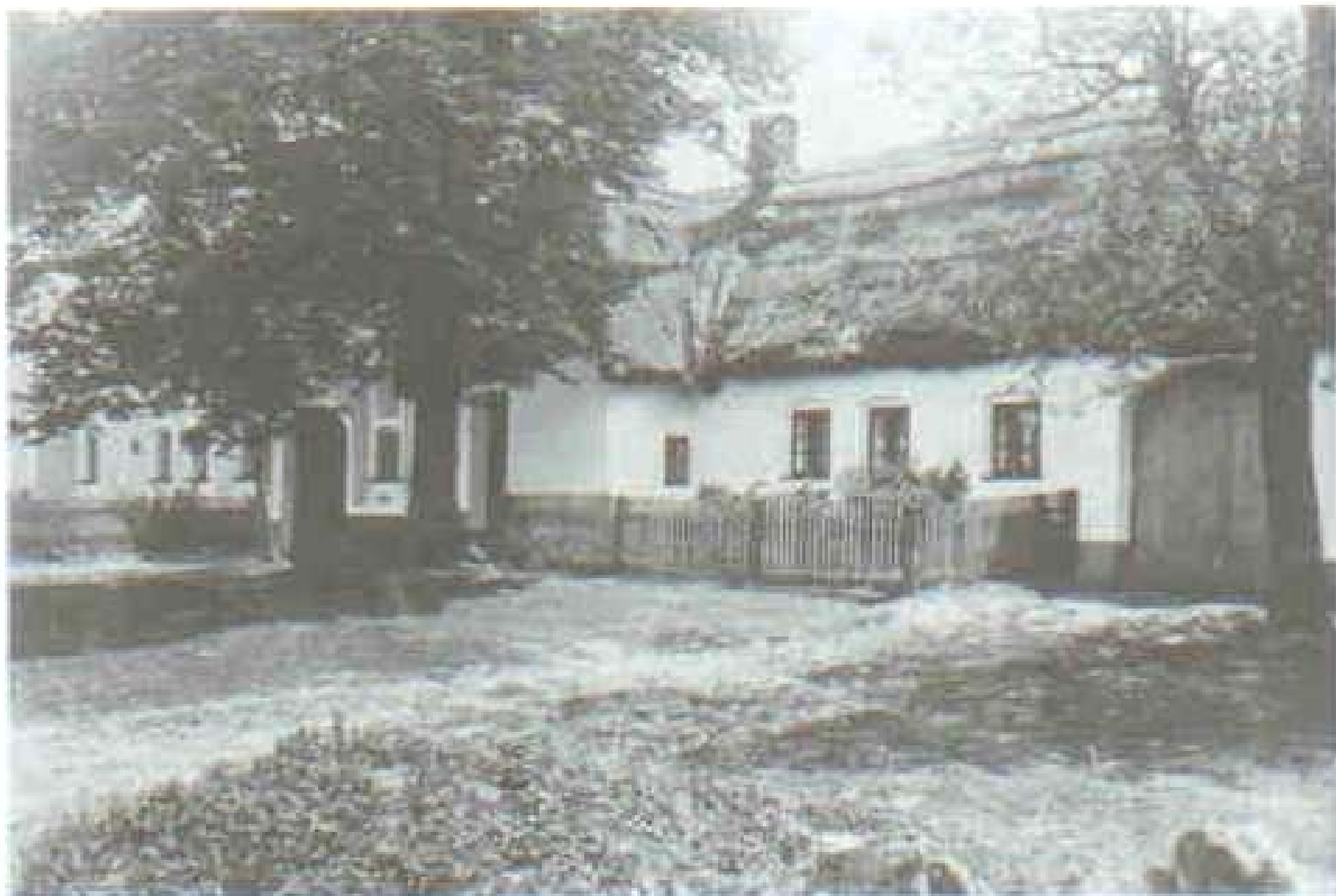
100 Jihohanačský hliněný dům. Rostěnice u Vyškova. Foto L. Marek 1914.