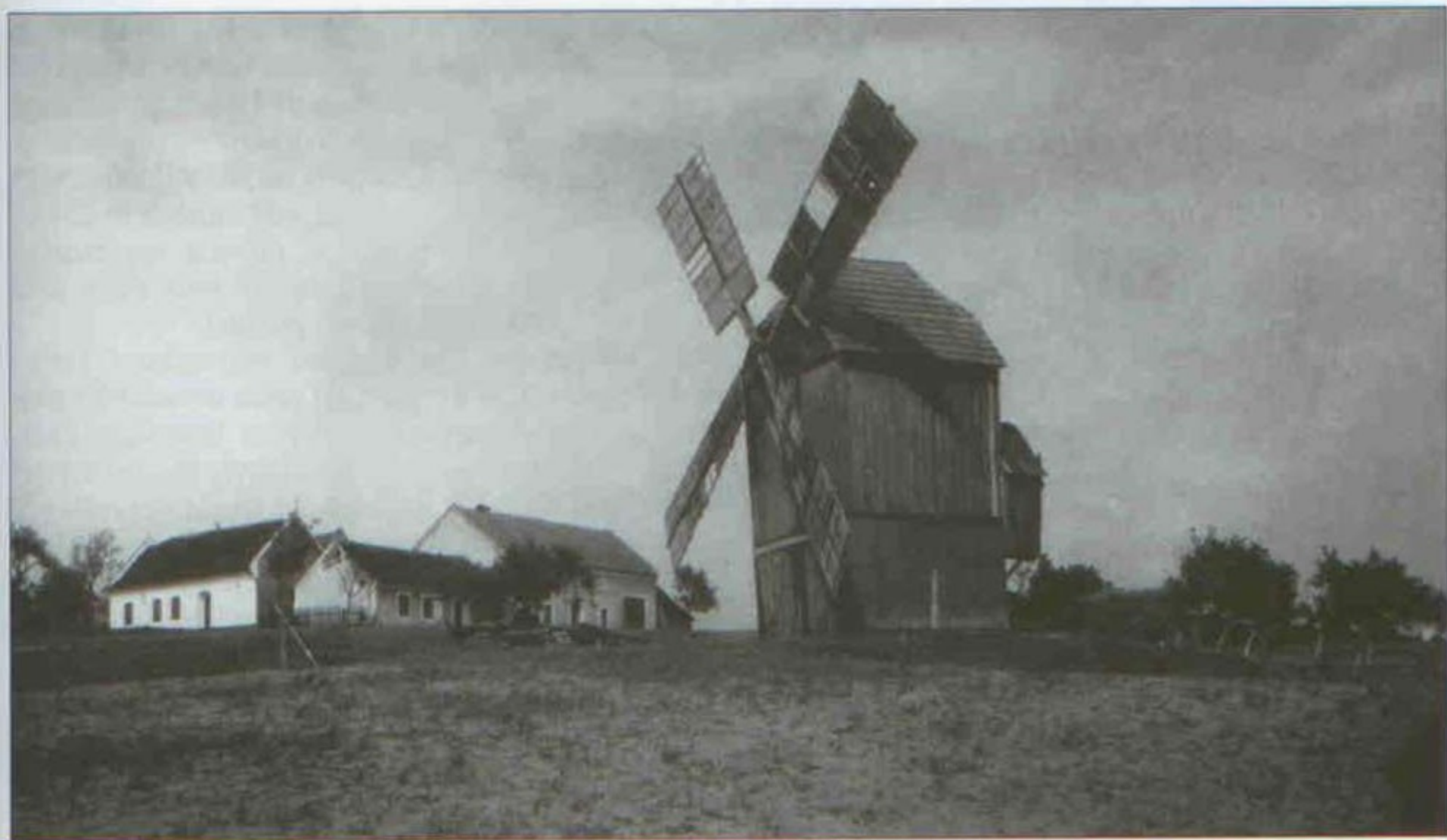
30 Větrný mlýn v Zeleně Hoře. Čtyřicátá léta 20. století.