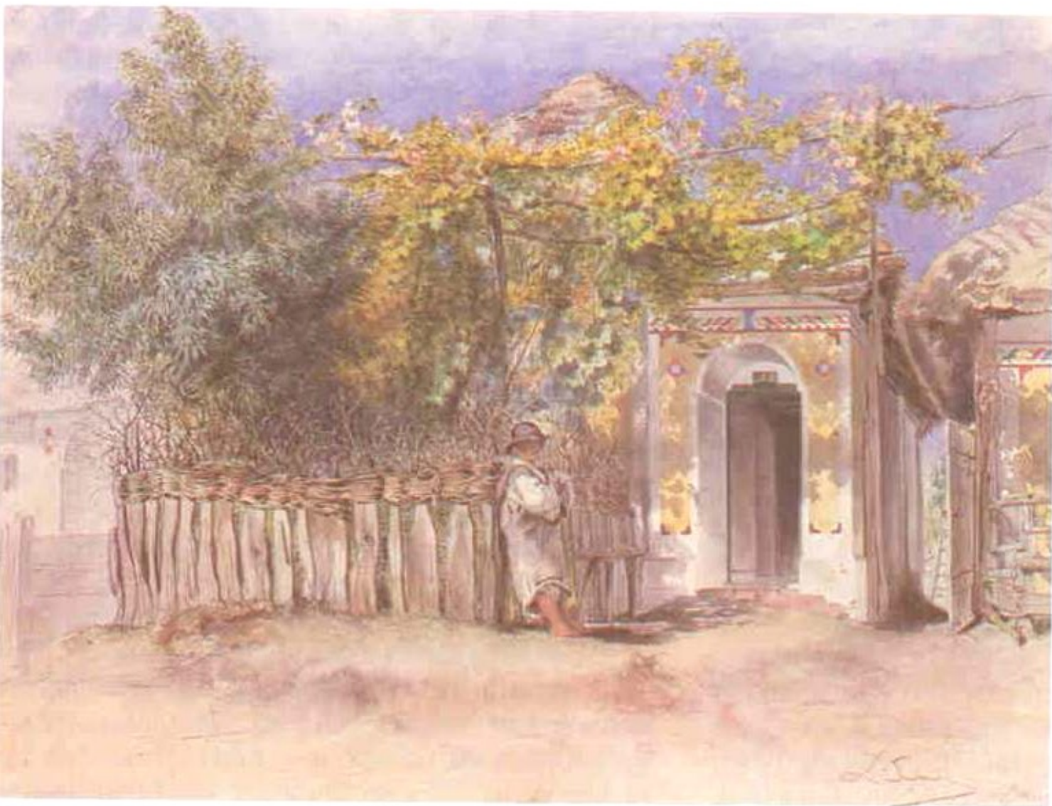
239 Nejstarší doklad názední malby z Podluží. Helešicův domek č. 168 ve Staré Břeclavi. J. Mánes, polovina 19. století.