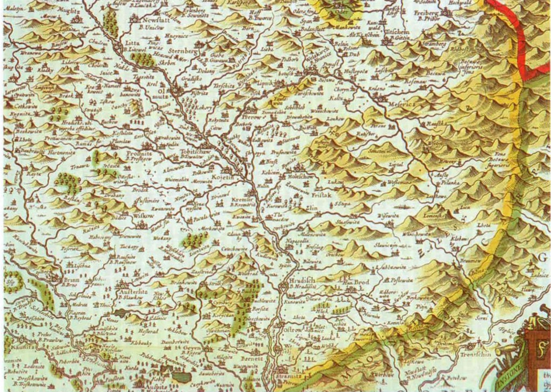
1 Část mapy Moravy od JA. Komenského z roku 1627 – nejstarší příklad kartografického zaznamenání národopisných oblastí (Hané a Zálesí) na Moravě.