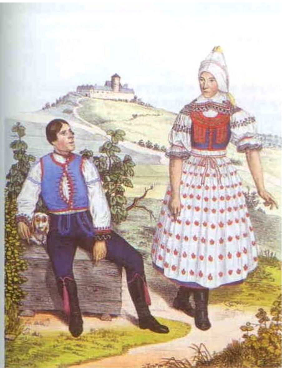
170 W. Horn: Manželský pár z milotického panství (1837).