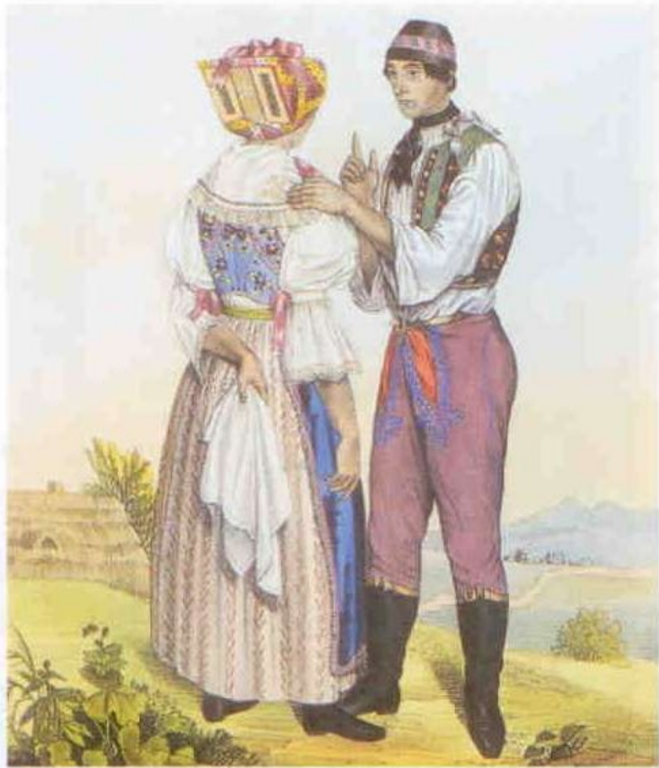
169 W. Horn: Manželský pár z břeclavského panství (1837).