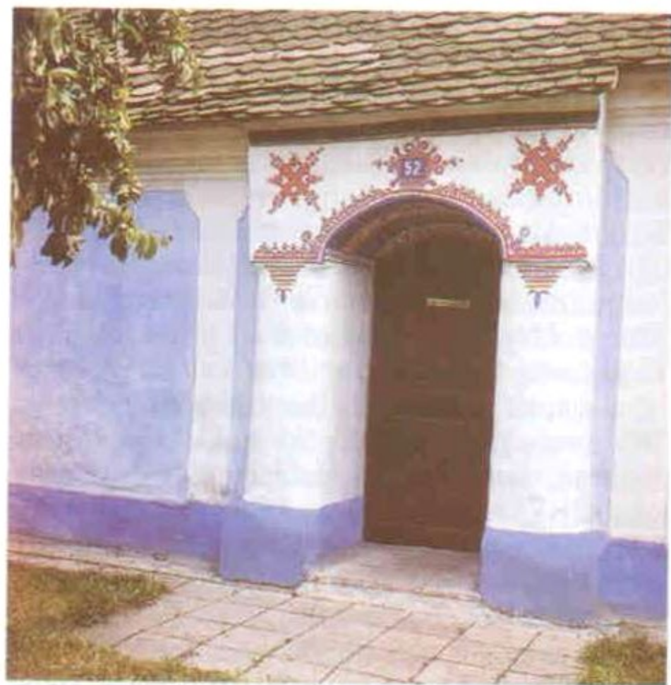
240 Malované žudro, Tasov č. 52. Foto R. Jeřábek 1979.