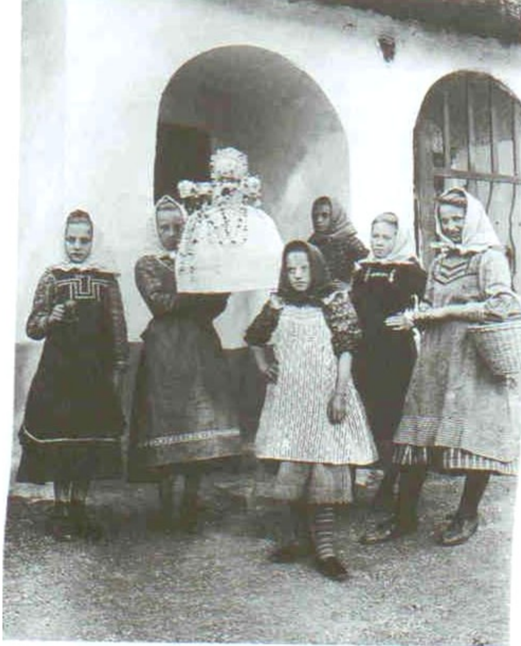
200 Vynášení smrtky v Ořechově u Brna. Děvčata se smrtolkou. Kolem roku 1914.