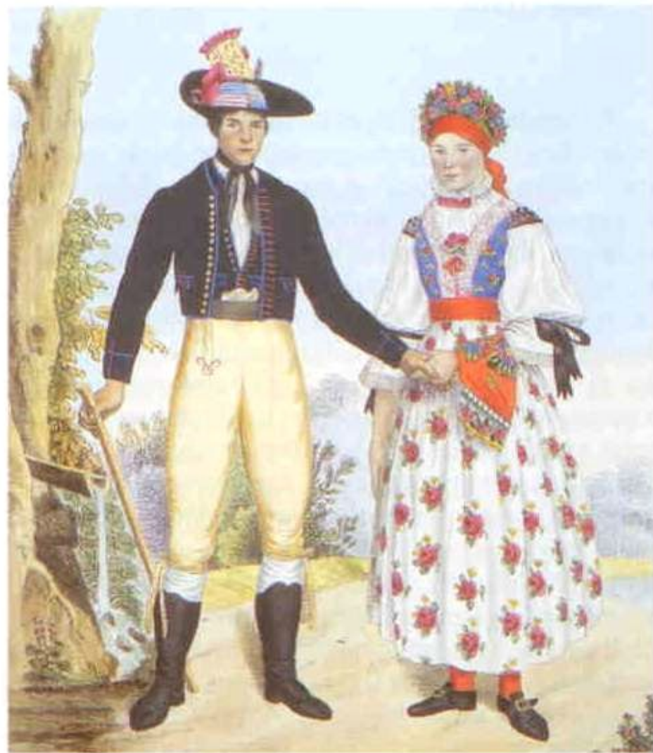
171 W. Horn: Svobodný pár z bzeneckého panství (1837).