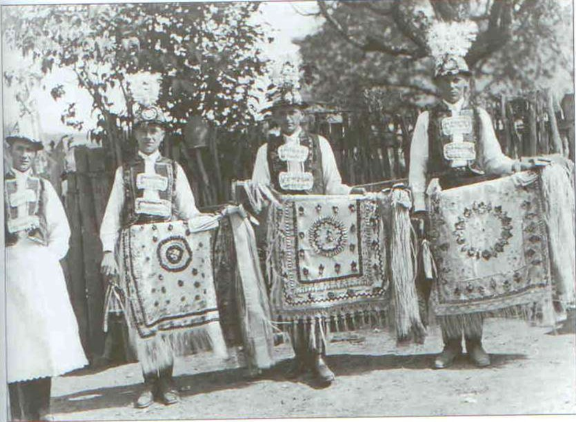
213 Stárci s prapory (fedry) a sklepník. Hody v Krumvíři v roce 1935.