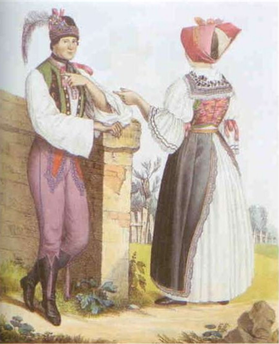
168 W. Horn: Svobodný pár z břeclavského panství (1837).