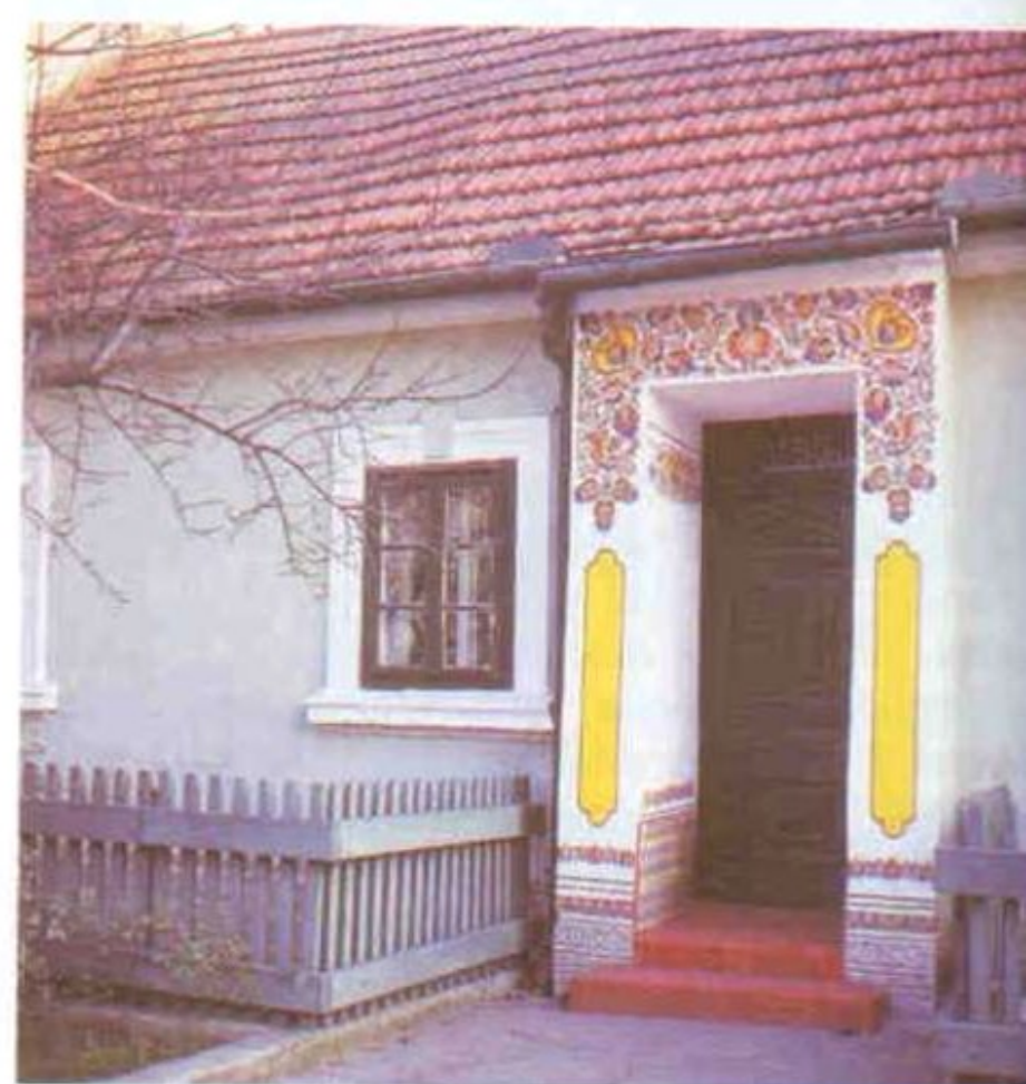
241 Poslední fáze názední malby na Podluží. Lanžhot č. 155. Foto R. Jeřábek 1977.