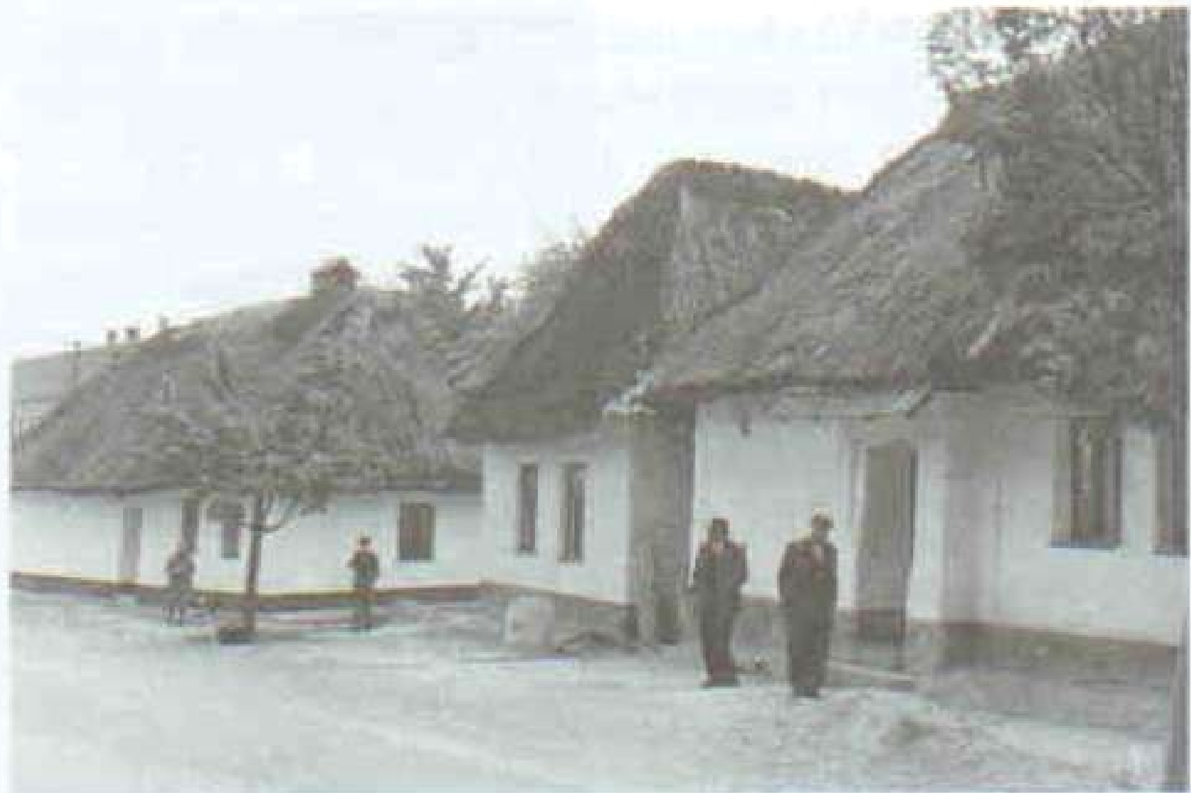
101 Valbové střechy kryté doškem. Ruprechtov na Vyškovsku. Foto K. Fojtík 1960.