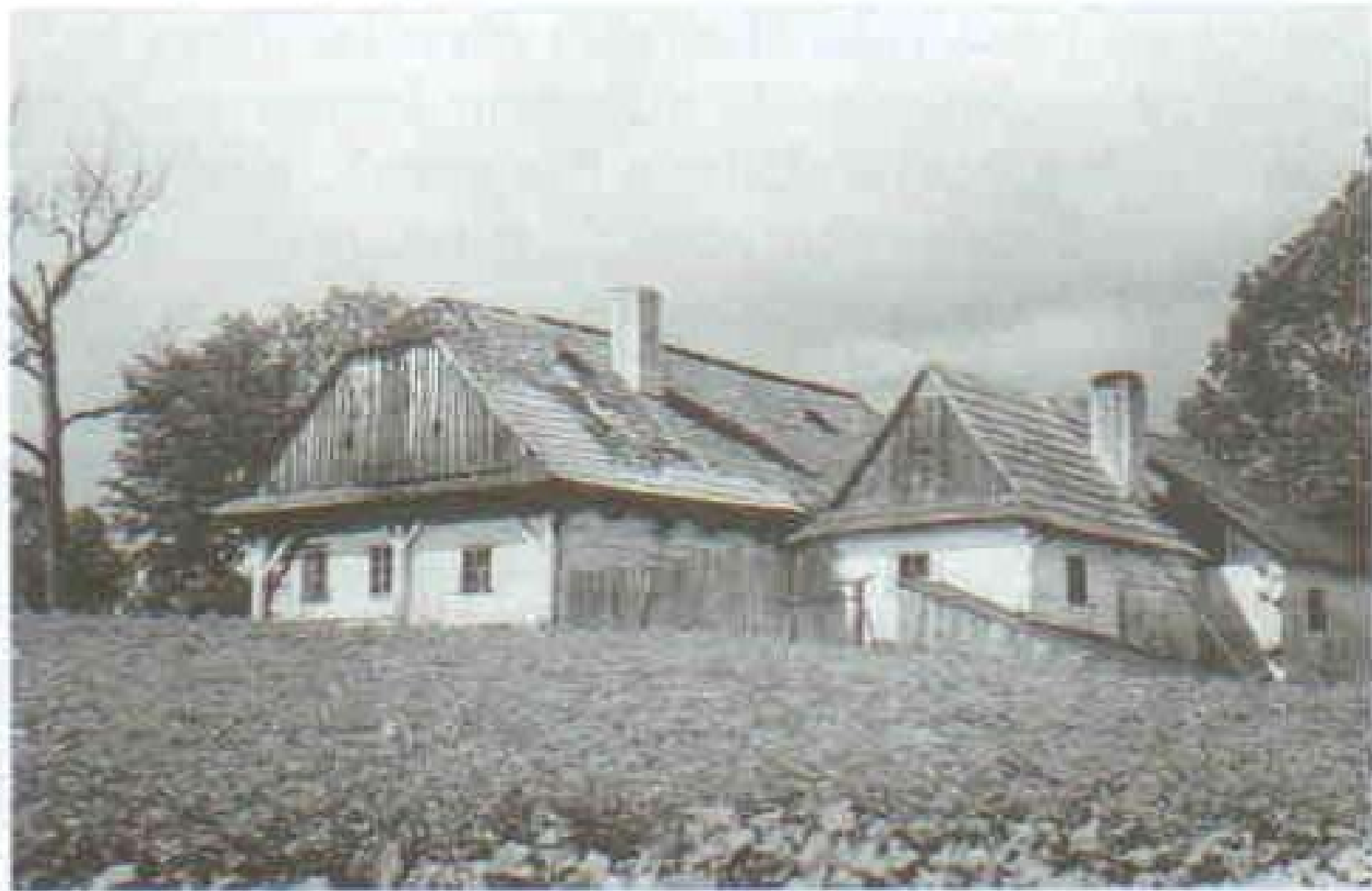
99 Roubená horácká usedlost s přistěnnými sloupy. Kadov u Nového Města na Moravě, 30. léta 20. století.