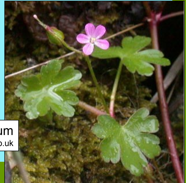
Geranium lucidum www.nature-diary.co.uk