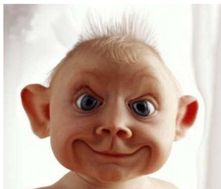
Obr. 2: Antidepressivum

\afterpage{\clearpage} – příkaz \clearpage je volán až při přechodu na novou stránku. Vyžaduje načtení balíku afterpage .