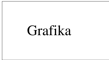
Obr. 5: Dlouhý text - centrováný.