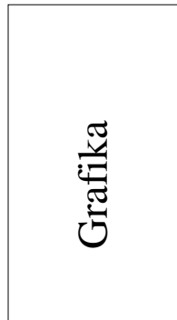
Obrázek 13: Otočený popis

\begin{figure} \centering \begin{minipage}[c]{1in} \includegraphics[angle=90,width=\textwidth]{box.eps} \end{minipage} \begin{minipage}[c]{0.5in} \rotcaption{Otočený popis}%vyzaduje balicek rotating \label{rotace1} \end{minipage} \end{figure}