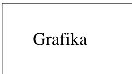
Obrázek 8: Vertikálně centrované