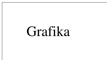
Obr. 6. Popis s novým oddělovačem

\centering \includegraphics[width=6cm]{box.eps} \renewcommand{\figurename}{Obr.} \caption[Dlouhý text - centrováný úzký.]{Dlouhý text - centrováný. Dlouhý text - centrováný. Dlouhý text - centrováný. Dlouhý text - centrováný. Dlouhý text - centrováný. Dlouhý text - centrováný. Dlouhý text - centrováný. } \label{popis3} \end{figure}