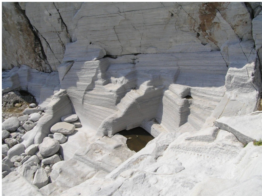
Řecko – Thasos Alyki – těžba mramorů , 6 stol př.n.l. – 6 stol. n.l.