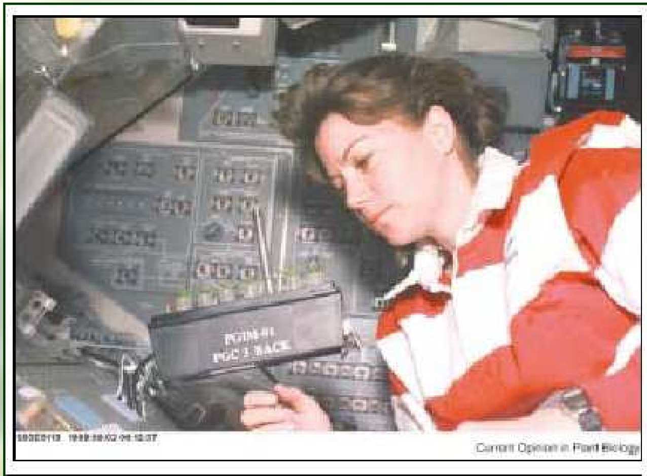
Astronautka Cady Coleman provádí pokus s rostlinkami Arabidopsis v průběhu letu na STS-93 (raketoplán Columbia, 1999).