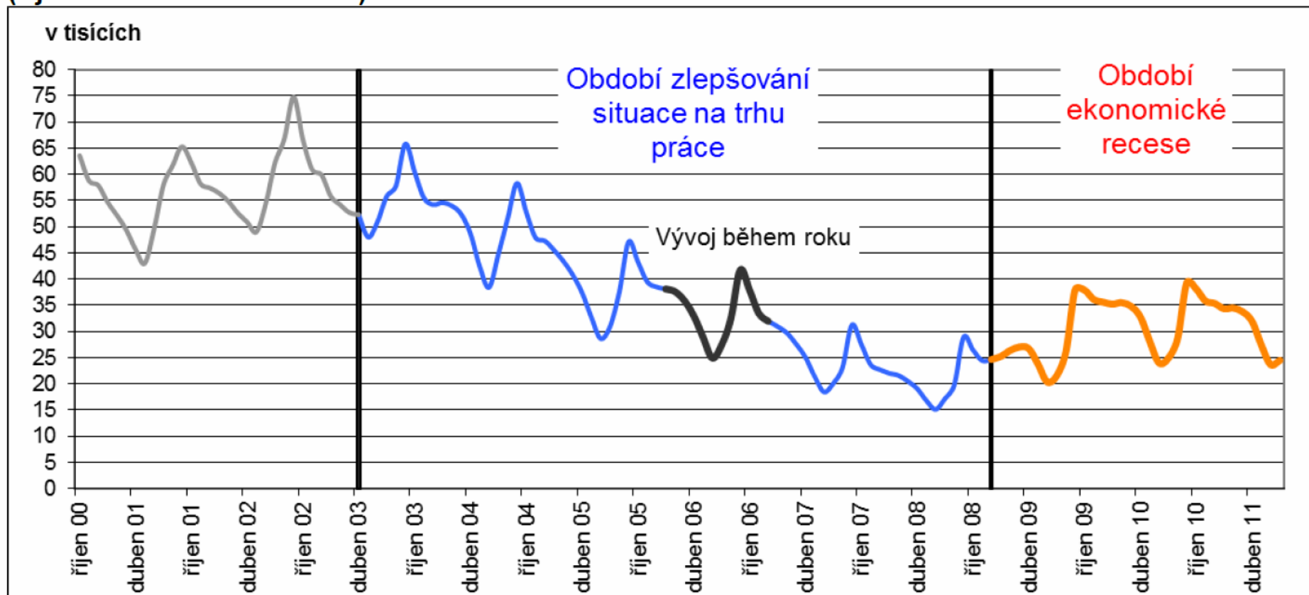
Obrázek 2.1 Vývoj počtu nezaměstnaných absolventů škol a mladistvých (říjen 2000–červenec 2011)