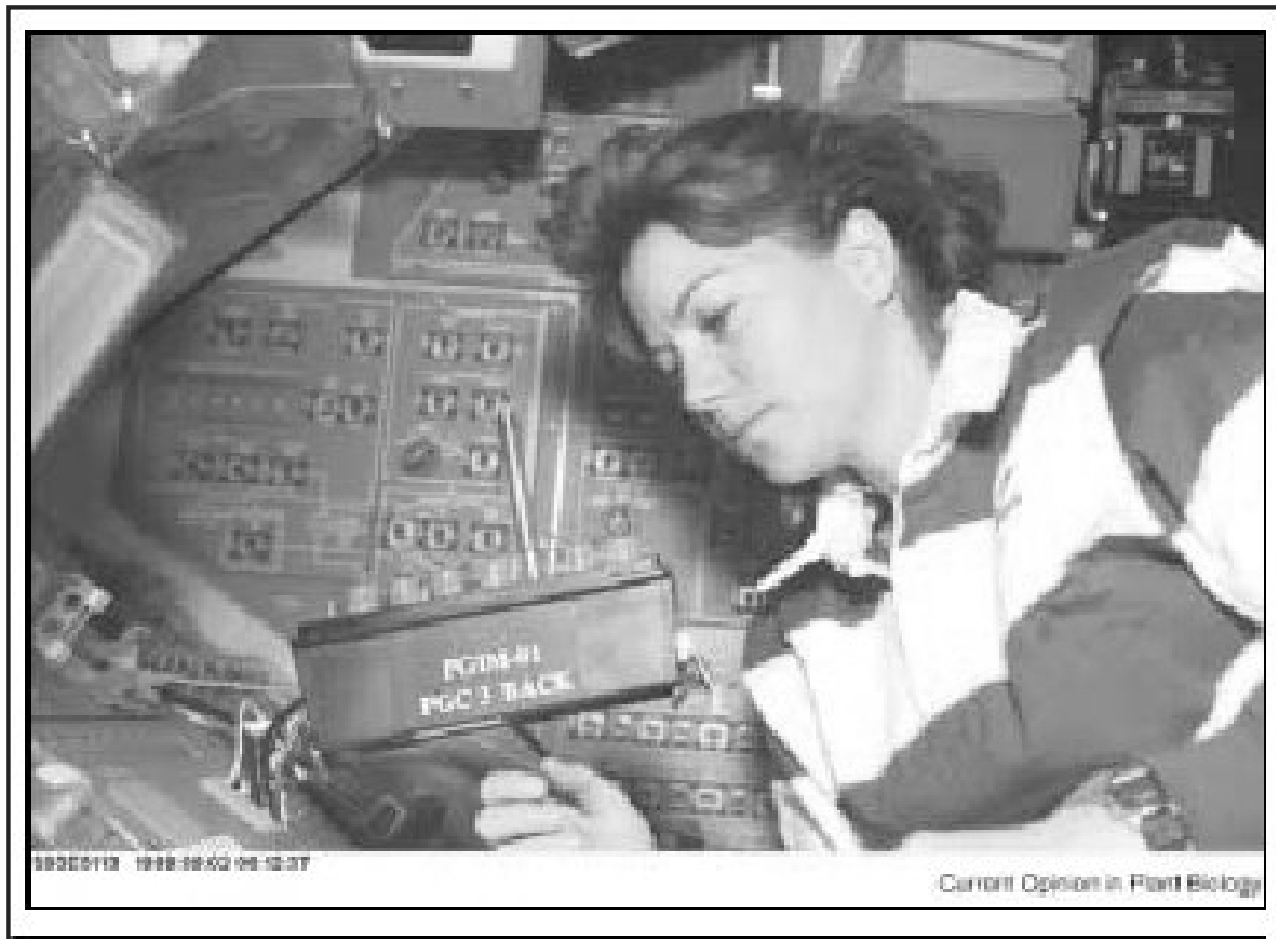
Astronautka Cady Coleman provádí pokus s rostlinkami Arabidopsis v průběhu letu na STS-93 (raketoplán Columbia, 1999).