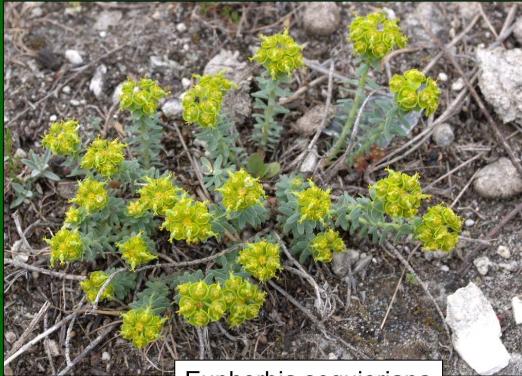
Euphorbia seguieriana subsp. minor