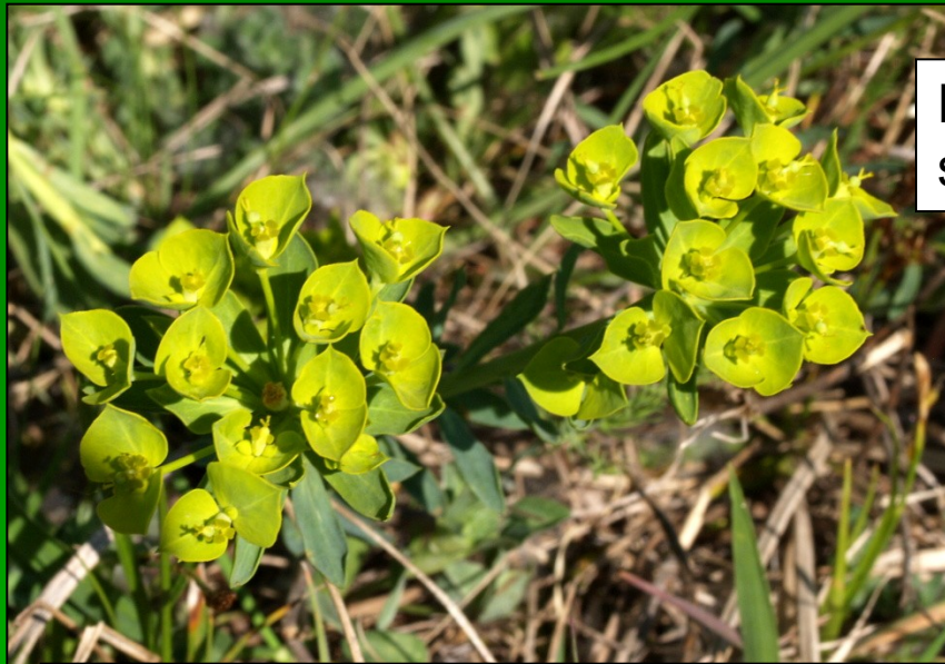
Euphorbia seguieriana subsp. seguieriana