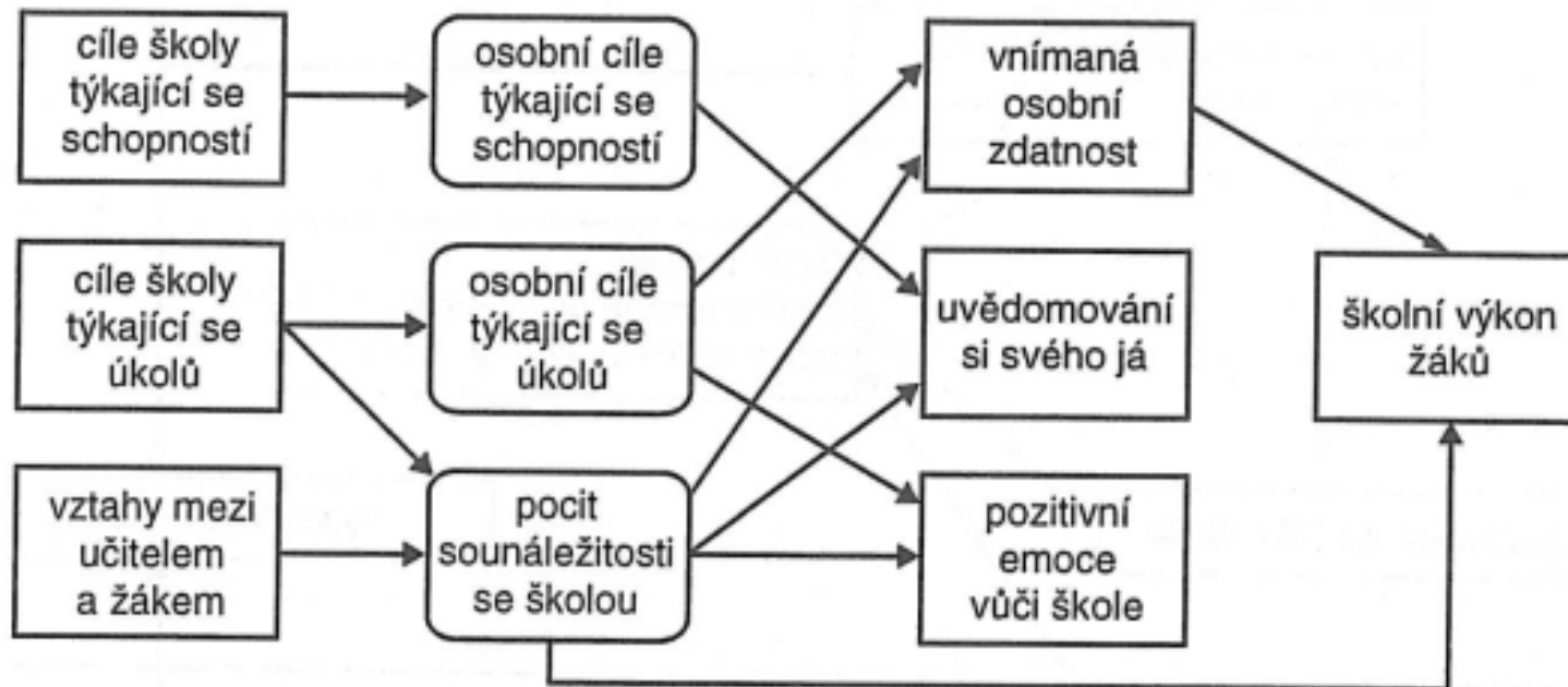
Obr. 20.2 Model klimatu školy (Roesler et al., 1996, s. 416)