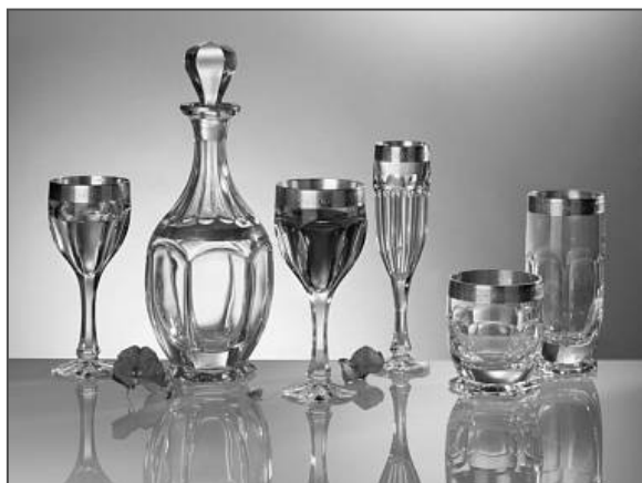
Obr. 5: Produkce skláren Květná

Sklárny Květná se tedy z téměř bezvýchodné situace podařilo zachránit. V současnosti se činnost sklárny s asi 150 zaměstnanci soustředí na výrobu hladkého, hutně tvarovaného skla a na zušlechťování výrobků svých i z jiných skláren. Otázkou je, jak si zdejší sice velmi originální, tradiční výroba s kusem historie v sobě dokáže poradit s novými technologiemi a automatizací ve sklářském průmyslu. Ta se totiž, bohužel pro ruční výrobu skla, začíná stávat velkou konkurenční výhodou (Bobčík, 2003; < www.hbi.cz >).