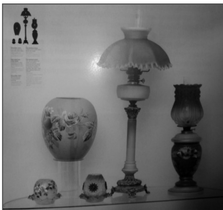
Obr. 4: Sběrka osvětlovacího skla v muzeu Valašské Meziříčí

Jelikož význačná sklářská společnost Osvětlovací sklo – LARES, s. r. o. musela po 150 letech na podzim roku 2003 ukončit svou činnost, stalo se muzeum ve Valašském Meziříčí správcem a uchovatelem té největší sbírky osvětlovacího skla na území České republiky. Exkluzivita velikosti, rozsahu a charakteru sbírky osvětlovacího skla je naprosto mimořádná dokonce i v evropském měřítku. Bývalá sklárna tak dostala vlastně příležitost – prostřednictvím muzejních expozic bude sbírka jejích produktů stále svědčit o bohaté historii tvořené bádavou, usilovnou, ale všemi skláři milovanou prací (Podzemná, Stanický, 2010; < www.muzeumvalassko.cz >).