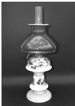
Obr. 3: Petrolejová lampa, výroba z 19. století, sklárny Karolinka

Sklárna Karolinka byla ještě před revolucí přiřčena do státního podniku Crystalex Nový Bor, který se po privatizaci stal akciovou společností. Na počátku nového tisíciletí však postihla karolinskou sklárnu recese, oslabení poptávky, což způsobilo zastavení hutní výroby. Veškerá hutní činnost byla ukončena v roce 2006, což stále nelibě nese obyvatelstvo obce, které ve zrušení skláren ztratilo zdroj obživy i kus pomalu se vytrácející historie a tradice. Dosud zůstaly v Karolince jen činnosti zušlechťování užitkového skla a skla dováženého k zušlechťování ze severočeských skláren v Nového Boru. Aktuální informace o zdejší sklářské výrobě je však taková, že v současné době malý moravský závod v Karolince oživuje výrobu užitkového stolního dekorovaného skla. Většina produkce směřuje na zahraniční trhy (Merendová, 2010; < http://www.crystalex.cz/ >).