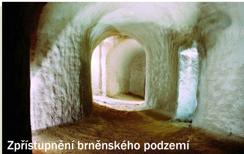
Zpřístupnění brněnského podzemí