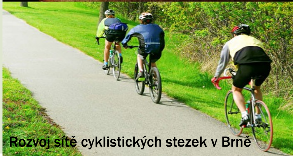
Rozvoj sítě cyklistických stezek v Brně