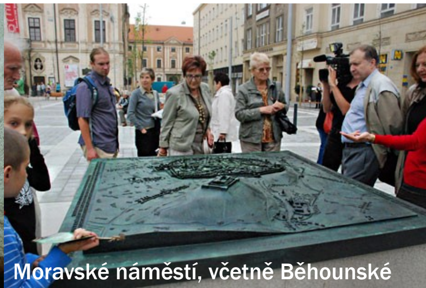
Moravské náměstí, včetně Běhounské