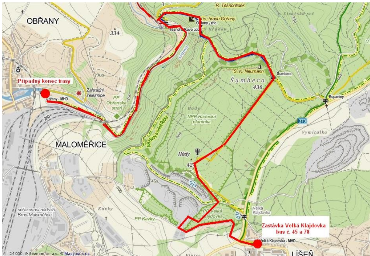
Obř. 2 Přibližná trasa exkurze se zakončením v Obřanech