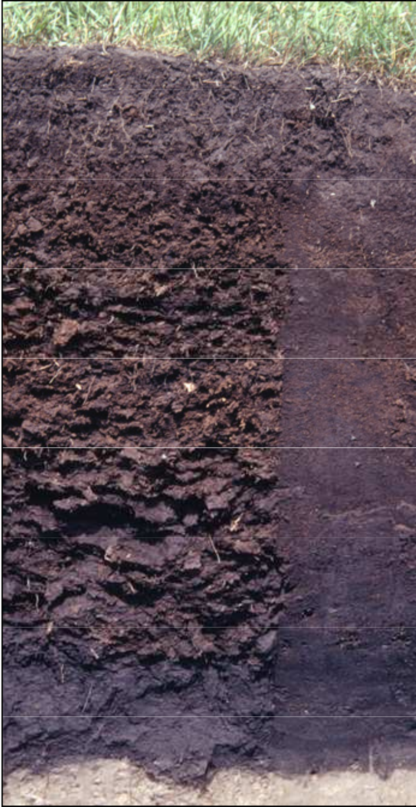
Global Distribution of Histosols