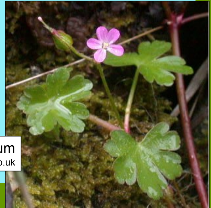
Geranium lucidum www.nature-diary.co.uk