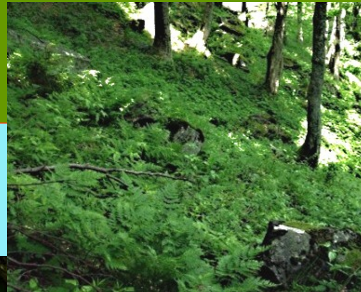
Cystopteris sudetica M. Kočí 2010