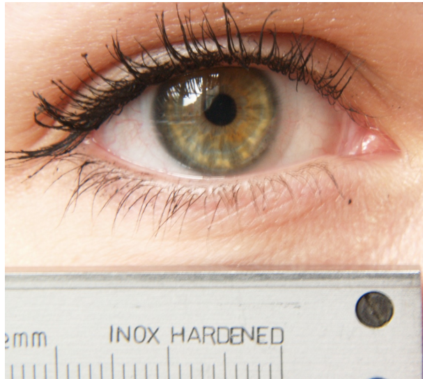
Obrázek 1: Snímek oka s přiloženým měřítkem pro určení rozměrů v obraze. Fotoaparát s předsádkovou čočkou jsou snímáné osobě maximálně přiblíženy a je zvolena vhodná clona za účelem dosažení vyhovující hloubky ostrosti snímku.