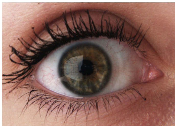
Obrázek 2: Snímek oka se zobrazeným pravoúhlým rastrem. Zakřivení oka způsobilo deformaci obrazce, z jejíhož proměření je možné zpětně určit poloměr křivosti rohovky v jejích různých místech.

V rámci sestavení zaznamenávané scény umístíme fotoaparát na optickou lavici přímo před oko; volíme tedy speciálně y_s = 0 . Jako zdroj, jehož obraz budeme na povrchu rohovky zachytávat, zvolíme pravidelnou mřížku, kterou umístíme po straně optické lavice. Přitom jak vzdálenost oka od fotoaparátu, tak zdroje od roviny oka změříme. Zdroj světla umísťujeme tak, aby jeho obraz vznikl blízko zornice.