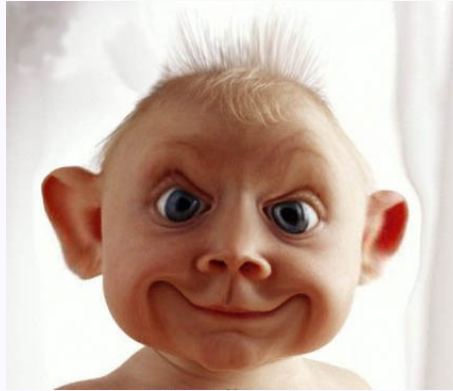
Obr. 2: Antidepressivum

\begin{figure} \centering \includegraphics[width=6cm]{anti.eps} \renewcommand{\figurename}{Obr.} \caption{Antidepressivum} \label{anti2} \end{figure}