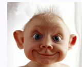
Obrázek 12: Anti2

Text odstavec. Text odstavec. Text odstavec. Text odstavec. Text odstavec. Text odstavec. Text odstavec. Text odstavec. Text odstavec. Text odstavec. Text odstavec. Text odstavec. Text odstavec. Text odstavec. Text odstavec. Text odstavec. Text odstavec. Text odstavec. Text odstavec. Text odstavec. Text odstavec. Text odstavec. Text odstavec. Text odstavec. Text odstavec. Text odstavec. Text odstavec. Text odstavec. Text odstavec. Text odstavec. Text odstavec. Text odstavec. Text odstavec. Text odstavec. Text odstavec. Text odstavec. Text odstavec. Text odstavec. Text odstavec. Text odstavec. Text odstavec. Text odstavec. Text odstavec. Text odstavec. Text odstavec. Text odstavec. Text odstavec. Text odstavec.