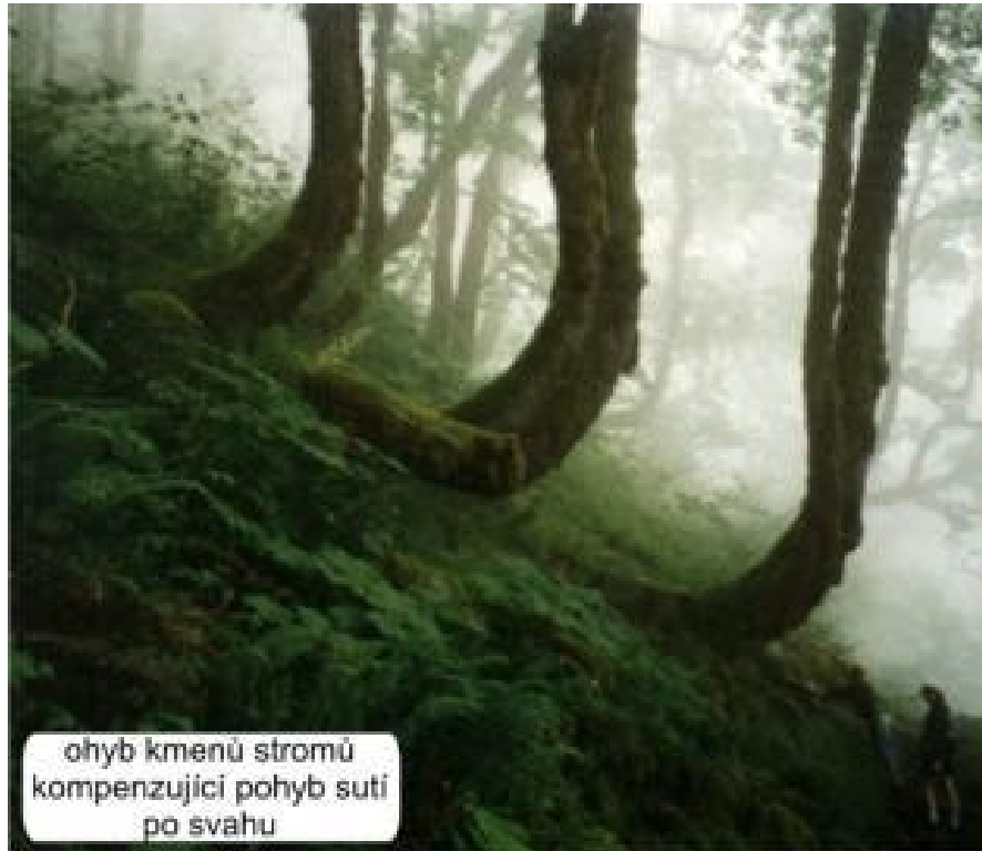
ohyb kmenů stromů kompenzující pohyb suti po svahu