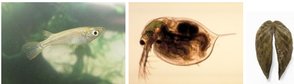
Obrázek č. 3 – Testy se provádějí např. na medace japonské, hrotnatce velké, slávičce mnohotvárné.

Testy pro tento parametr jsou nejpokročilejší a existuje také největší spektrum možných testů., patří tedy do běžné sady. Nejčastěji se využívá testů na bakteriích, řasách, korýších, vířnicích ( Brachionus calyciflorus ). Zaměřují se například na faktory, kterými je přežití u perlooček ( Daphnia magna ), luminiscence u bakterií Vibrio fischeri a růst zelených růst. Patří sem také 72 hodinový test klíčivosti semen hořčice bílé ( Sinapis alba ) Testy jsou vhodné pro všechny typy vod (sladké, slané, brakické) a ideálně by měly být testy se vzorky slané vody testovány na organismech, které se žijí ve slané vodě apod.