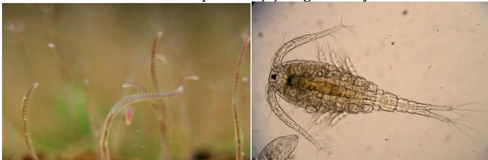
Obrázek č. 4 – Testy se provádějí např. na nitěnkách a buchankách.

Jedním z problémů odpadních vod je bioakumulovatelnost chemických látek. Jejich dopady se tak většinou projeví až po delší době expozice. A krátkodobé testy je tak nezachytí. Dlouhodobé testy umožňují posouzení dopadů na životní funkce organismů v různých fázích životního cyklu, včetně rozmnožování, růstu, pod vlivem hormonálních změn nebo dopadů na jejich genetický materiál.