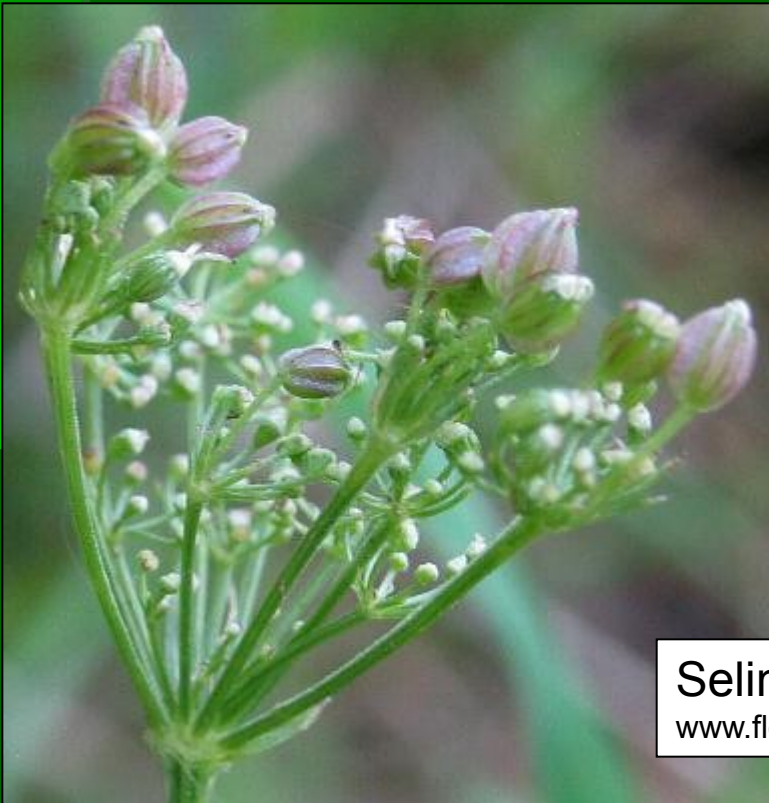
Selinum carvifolia www.flogaus-faust.de