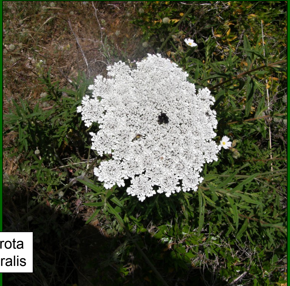
Daucus carota subsp. littoralis