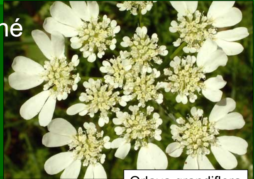
Orlaya grandiflora