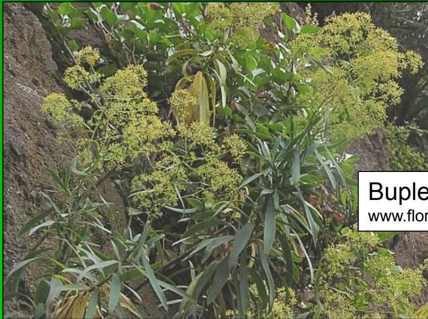
Bupleurum salicifolium www.floradecanarias.com