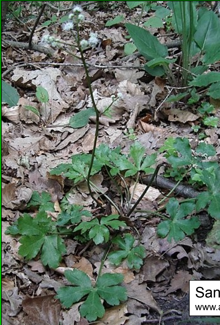
Sanicula europaea www.atlas-roslin.pl