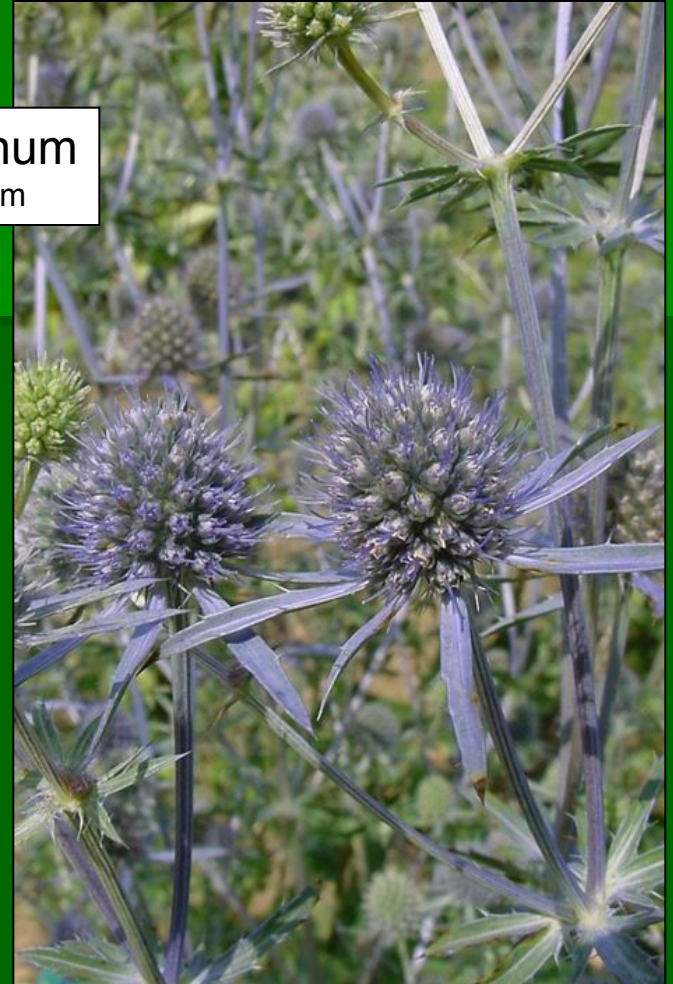
Eryngium planum www.mytho-fleurs.com