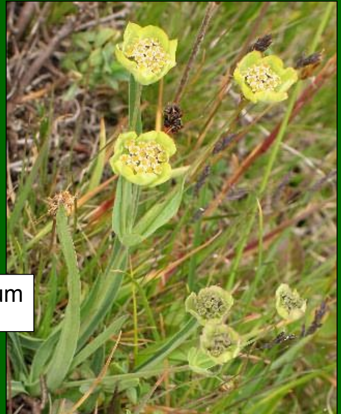
Bupleurum salicifolium www.flogaus-faust.de