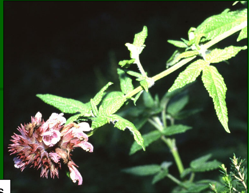
Cedronella canariensis