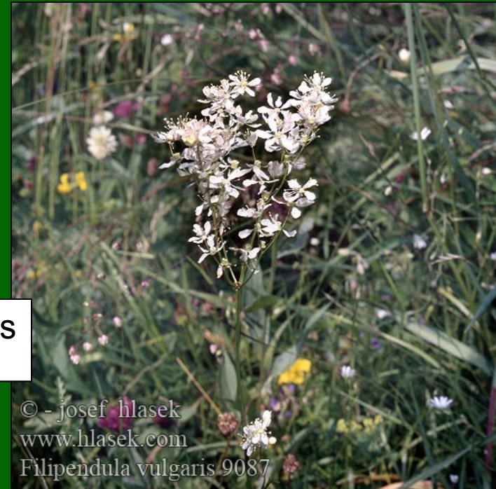
Filipendula vulgaris www.hlasek.com

© - josef hlasek www.hlasek.com Filipendula vulgaris 9087