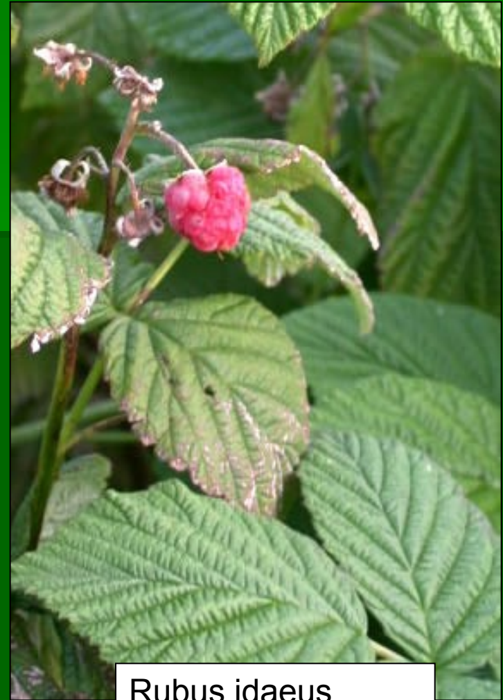
Rubus idaeus www.plant-identification.co.uk