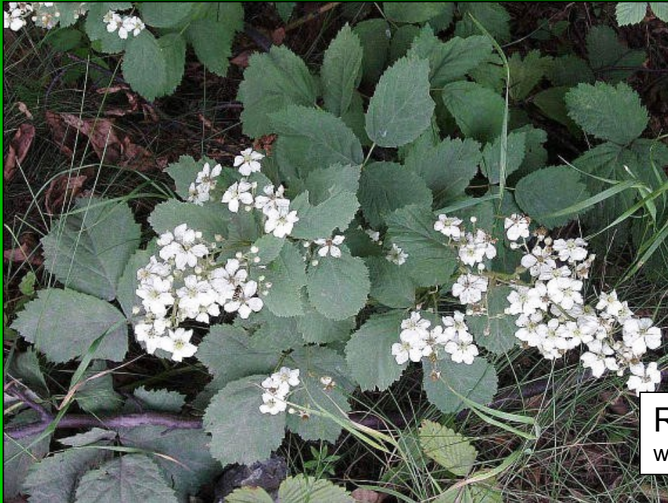
Rubus canescens www.riostliny.nikde.cz