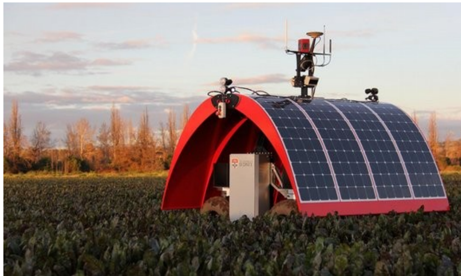
Robot Beruška (Ladybird)

Pro naplňování cílů a potřeb v oblasti předávání znalostí a inovací v zemědělství byla na základě analýzy a posouzení potřeb vybrána následující opatření, která jsou shodná vzhledem k vzájemné provázanosti a souladu cílů pro všechny tři prioritní oblasti: