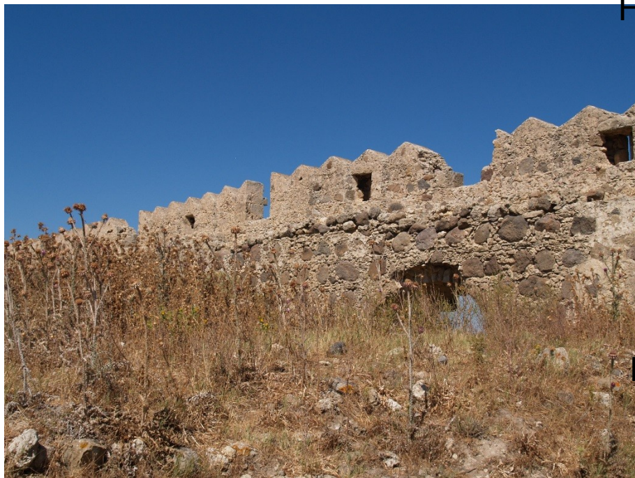
Kos - Antimachia