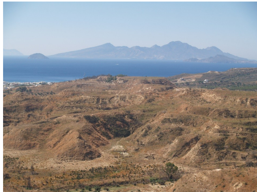
Kos – Asklepion Hippokrates