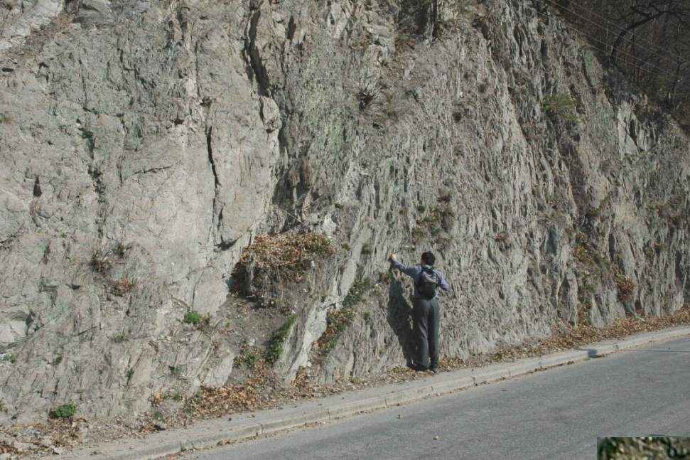
Josefovské údolí Moravský kras