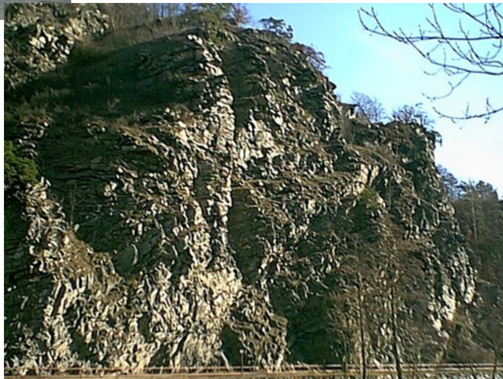
Hamerské vrásky NP Podyjí