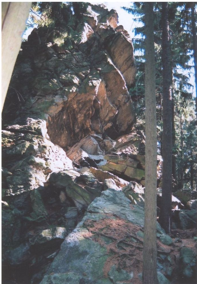
Dráteník – CHKO Žďárské vrchy