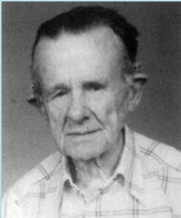
Carl Harald Cramér (1893 – 1985): Švédský matematik